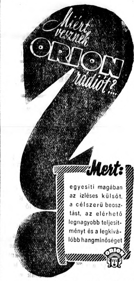
Kapható minden Orion rádiókereskedőnél