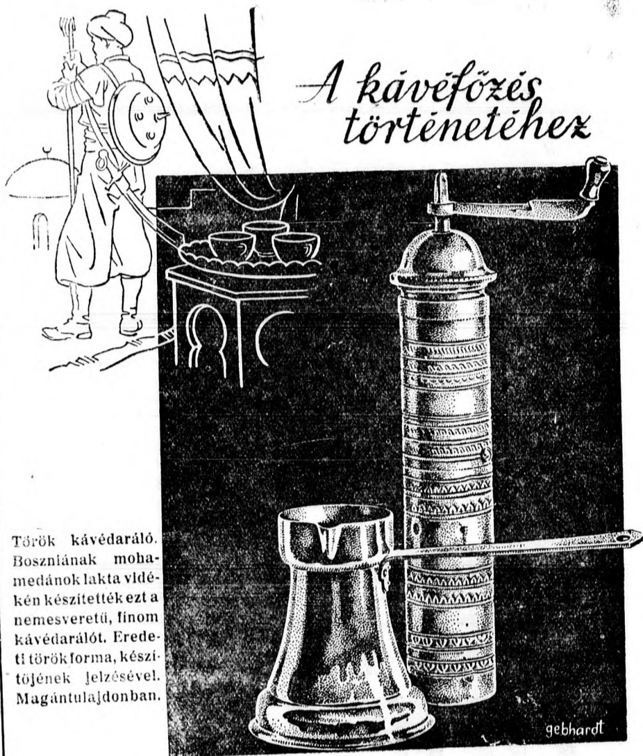
Török kávédaráló. Boszníának mohamedánok lakta vidékén készítették ezt a nemesveretű, finom kávédarálót. Eredeti török forma, készítőjének jelzésével. Magántulajdonban.