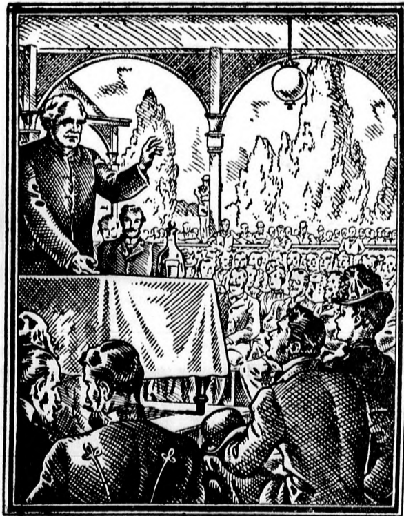
1938 nyarán látogatók el másodszor hozták Kneipp. Az egykorú újságok sokat írtak látogatásáról; ezekben sok olyan érdekes feljegyzést találunk, melyek a hősnőre ma is nagyon érdeklődik és figyelmét leköti.

És — ami szintén fontos körülmény — fillérekért megszeresheti a szépségüktől megígészett szemlélő, aki akár az egészen luxus kivitelű szimpompás karácsonyfadisze, akár egyszerűbb kivitelű testvéreit vásárolja, mindenképpen szép és művészi holmihoz jut.