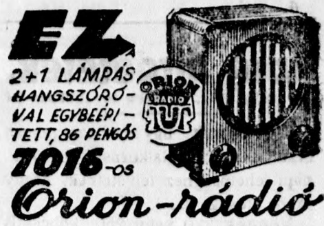
Gyártja: Orion Izzólámpagyár

— Ehízott egyéneknek a természetes „Ferenc József” keserűvíz kura ha almasan előmozdítja a bélműködést, a testet könnyedé teszi s ezáltal a test és nyugodt alvást teremti.