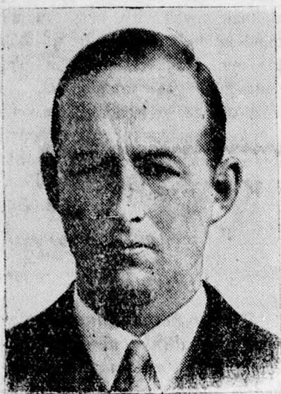
Starhemberg osztrák alkancellár a szilvesztert és az újévet Magyarországon tölti.

a gyilkosság pénteken este fél hat és hat óra között,