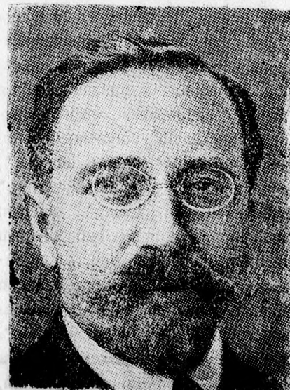
Kamenev, szovjet népbiztos, akit a Sztalin ellen tervezett merénylet miatt a hírek szerint több társával együtt Szibériába száműzték.