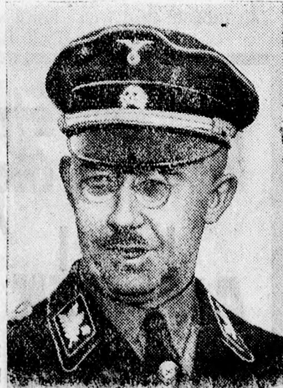
Dr. Himmler, a német rohamcsapatok főnöke, aki hír szerint ellentétbe került a birodalmi hadsereg vezetésével.