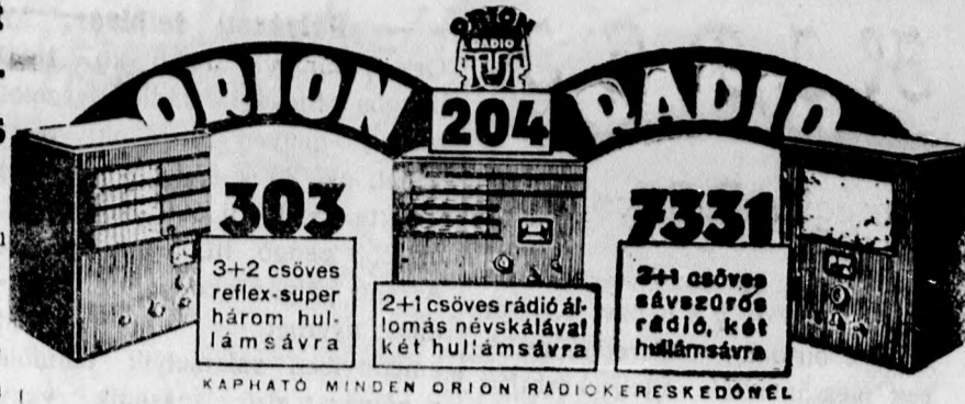
KAPHATÓ MINDEN ORION RÁDIÓKERESKEDŐNÉL

A modern világ egy szomorú jelensége, a nemzetpusztító egyke és egyse, az utóbbi években mind jobban észrevételezhető pusztító hatását a bajai anyakönyvi hivatalban is. A születések száma az elmúlt esztendőben nemcsak a halálozások számánál volt kisebb, hanem még az 1933 évi születések számával szemben is csökkenést mutat. Baja város 1934 évi anyakönyvi statisztikája a következő: 1934-ben 457 születést jegyeztek be, 39-cel kevesebbet mint 1933-ban. Elhaltak a múlt évben 527-en. Jánosalmán az elmúlt évben a