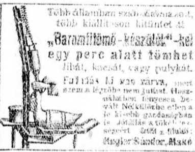
Több alkalommal szobrászatok, több kiállítások kiállításai.

"Baramiföldi-készlet"-kel egy perc alatt tömhet