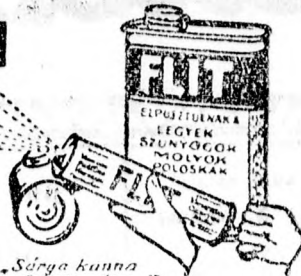
„Sürgye kanna leheté sával”

ELPUSZTULNAK A LEGYEK, SZUNYOGOK, MOLYOK, HANGYÁK, POLOSKÁK, BOLHÁK, TETVEK, SVÁBBOGÁRÁK.