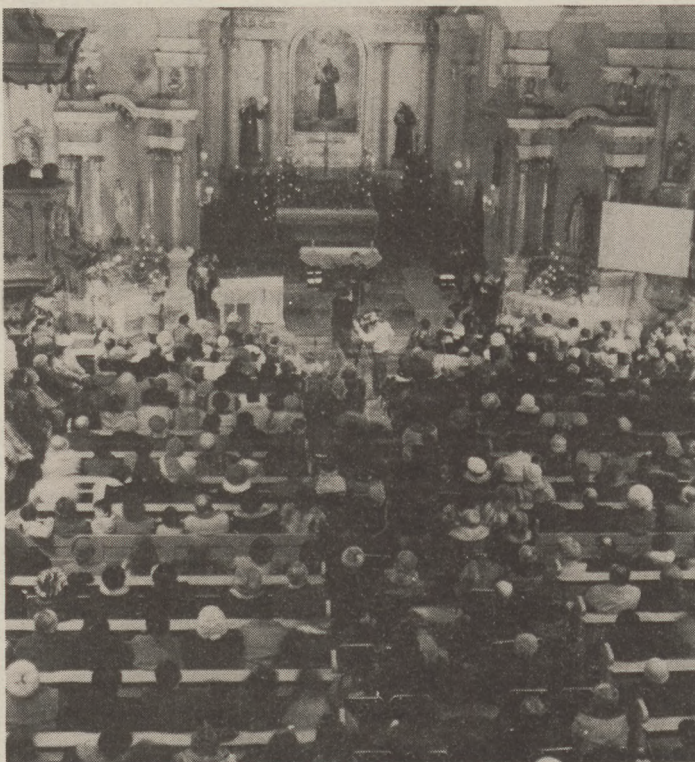
Feledhetetlen élmény volt...