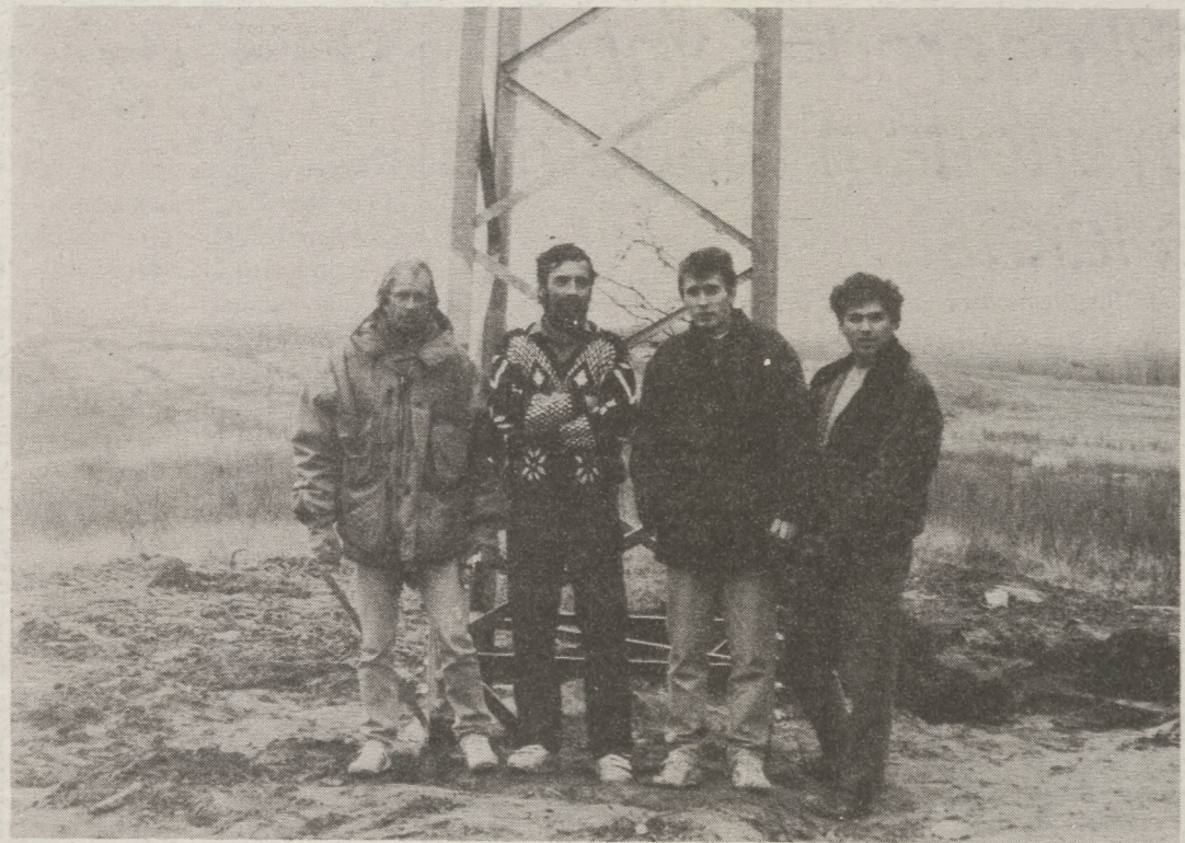
A Herz GMK szerelő a Dél TV adótornya előtt...

Ami a részéről, a Dél TV igazgatójaként tett ajánlatot illeti, nyugodtan mondhatom, semmiféle érdemi választ nem kaptam, továbbmenve, még csak konkrét kérdés feltevésére sem méltatott a tisztelt gyülekezet. Pedig dühömben és kínomban még azt is felajánlottam, hogy próbaképpen, minden ellenszolgáltatás nélkül akár hónapokig átveszem és sugárzásra bocsátom a helyi stúdió által készített műsorokat, így megoldva azt, hogy az a sokezer ember, akinek évek óta hiányoztak a kábelrendszerbe való bekötés ígéretével, azokat élvezni tudja. Ezzel szemben csak azt kértem – és ezt sem kizárólag jelleget –, hogy a kábelhálózatban szabadítsanak föl egy csatornát, abból a célból, hogy például a lakótelepen élők, akiknek központi antennáikat, mint tudjuk, leszerelték, nézhessék a Dél TV műsorát. Ha ezek után valaki azt hiszi, hogy erre bárki is rámozdult a jelenlévők közül, az ugyanolyan naiv balek, mint én. Ezek után – gondolom, nem rója senki bűnműl – azt kell mondanom, hogy a város jelenlegi vezetői és képviselői fölött végérvényesen eljárt az idő, alkalmatlanok arra a