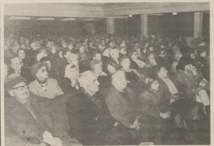
A nyugdíjasok szünni nem akaró tapssal háláltak meg a műsort