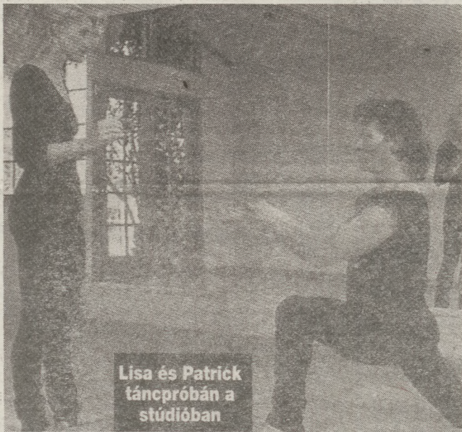
Lisa és Patrick táncpróbán a stúdióban

A fiatalos arcú sztár nemrég töltötte be a negyvenedik évét. De táncolni még tud és akar – „még 85 évesen és hőfehér hajjal is”. Azonban a „Dirty Dancing” sztárja, Patrick Swayze mostantól fogva már csak egyetlen nőt akar a kezében tartani: szép feleségét, Lisát.