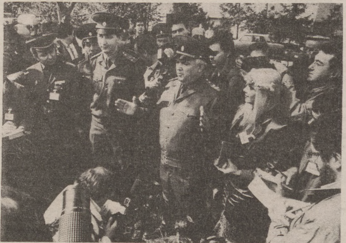
Ha akkor Cicciolina már sejtette volna ez a balhét, betartott volna nekik