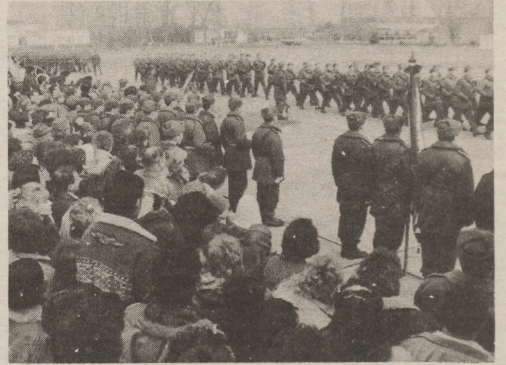
Az újoncok elvonulnak a parancsnoki emelvény és az alakulat zászlaja előtt.