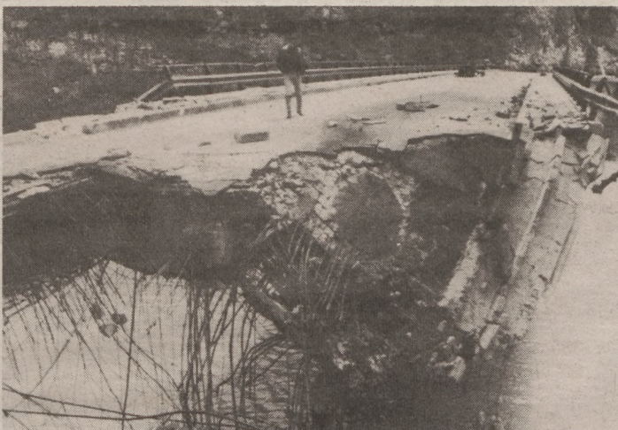
Felrobbantott híd a Neretva folyón

– Az egészet nem lehet elfelejteni. Technikus kollégám Romániából települt át Magyarországra. Nagyon örült annak, hogy magyar lehet. Kint azonban jónéhányszor leányáztak bennünket, és rájött arra, hogy nem is olyan jó mindig magyarnak lenni. Mélyen bennem maradt az a kísérteties csönd, ami akkor uralta a várost éjszaka, amikor nem lőttek. Le volt sötétítve az egész város, csak