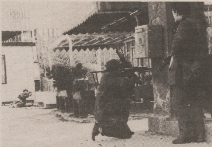
Utcai harcok Szarajevóban

– Nem sok. Akkor is a családomat hívtam telefonon.