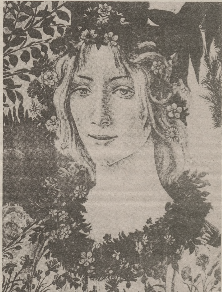
Sandro Botticelli: Flóra feje. Részlet a Primavera (A tavasz) című remekművéből

A tavasz hírnökei Sándor, József és Benedek – ez a három jeles névnap – a naptárban kevés híján egymás mellett van. Holnap lesz Sándor, pénteken József és vasárnap Benedek, aki – remélhetően – zsákban hozza meletet. Így tartja ez az évezredes tapasztalatokra épülő népi időjósítás, nem úgy, mint az a rátótiáda – falucsúfoló vidám népi adoma –, amely történet szerint zsákban akarták télre a meletet tartósítani.