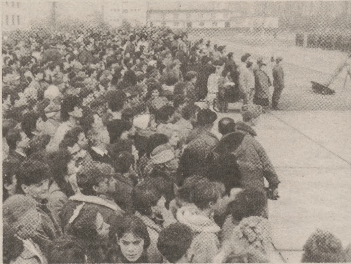
A mintegy 3000 főnyi hozzátartozó az ünnepélyes eskütételt várja.