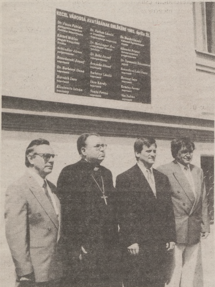
Vigyázzállás a Himnusz alatt...