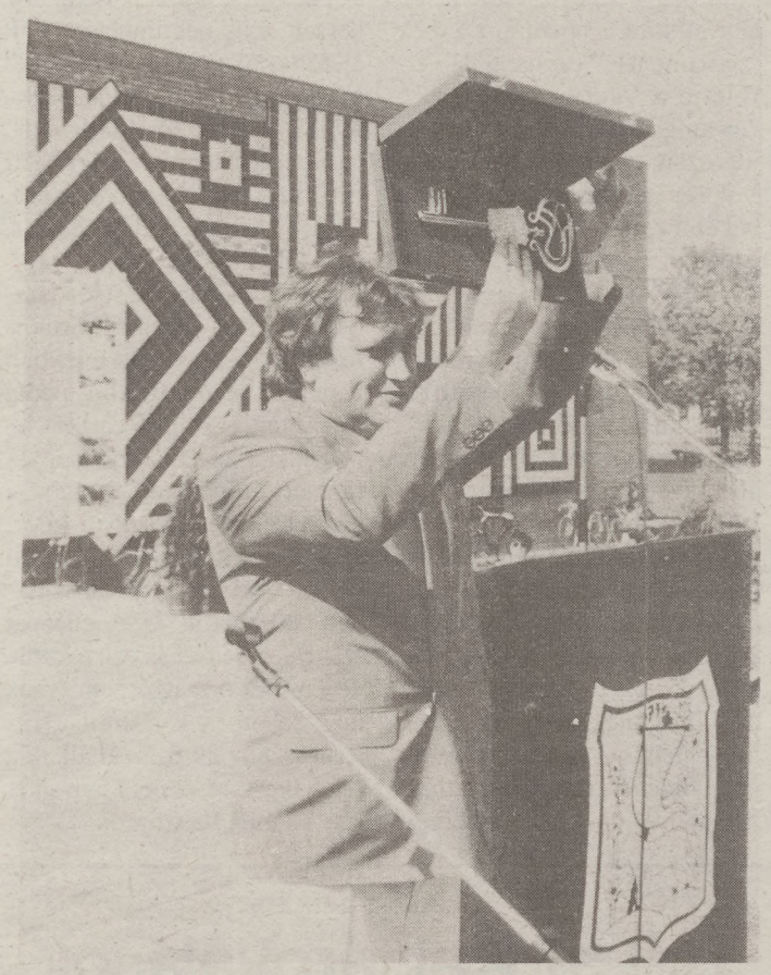
A polgármester a város kulcsával

Háromnapos rendezvénysorozat előzte meg a keceli városavató ünnepség napját. Volt borverseny, sport és városavató diszkó. A negyedik napon, április 25-én vasárnap reggel a Fürtös Vendéglő előtti parkolóban a Kalocsai Honvéd Fúvószenekar ébresztette a belváros lakóit. Délután 10 órától vette kezdetét a hivatalos városavató ünnepség az Arany János Általános Művelődési Központ előtt felállított színpadon, ahol a Himnusz hangjai után dr. Józsa FABIÁN, a Belügyminisztérium politikai államtitkára szövegezte az összegyűlt több száz emberhez.