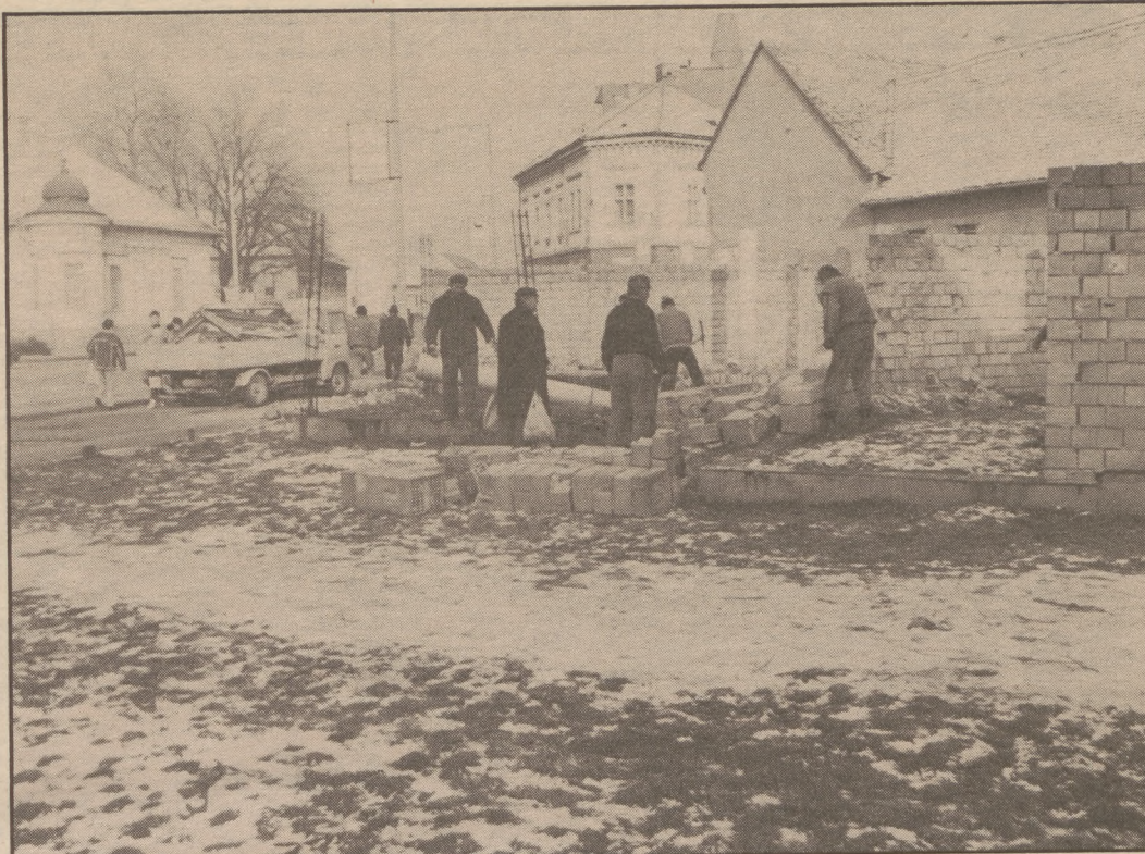
Miért kellett erre ennyit várni?