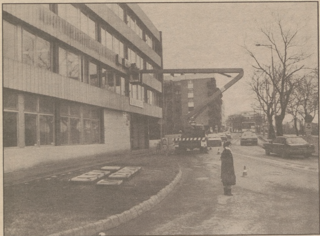
A valaha több száz embernek munkát adó Bajai Mezőgazdasági épületéről a minap leszerelték a neonfeliratot is. Eltörölte a privatizáció...