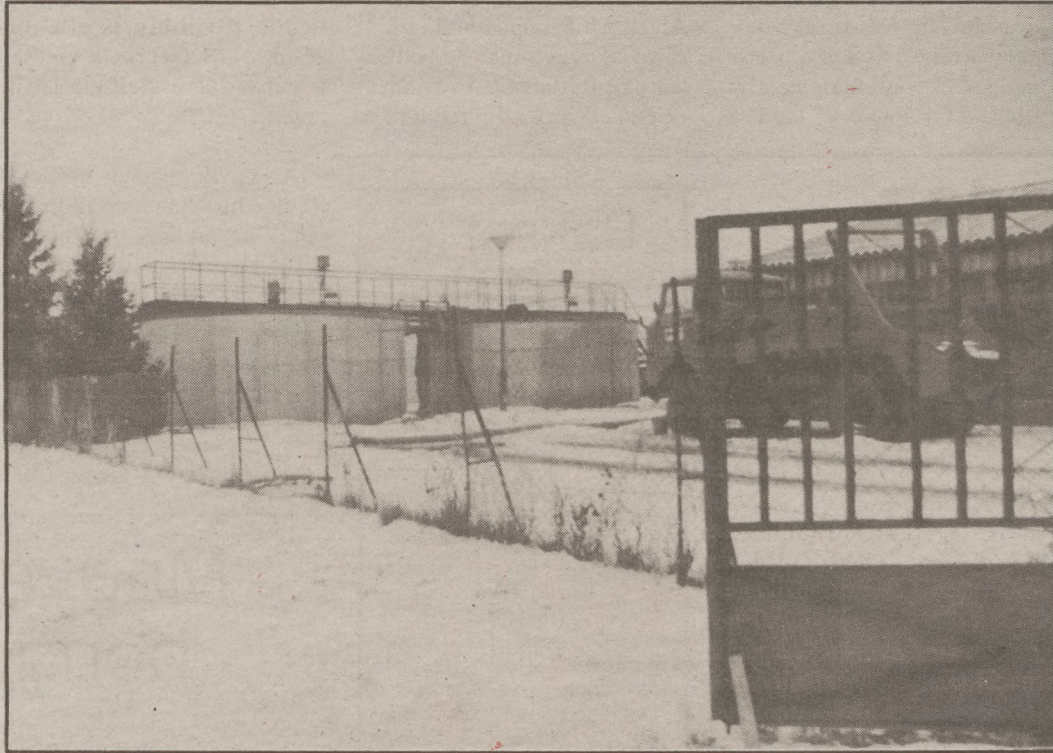
Az iszapot olykor nem szállítják el, hanem a Dunába engedik