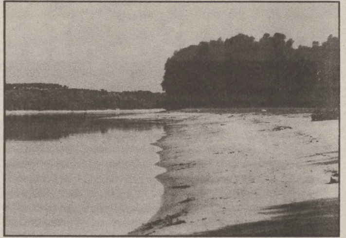
A vizek Baja legfőbb kincsei

– Nem tudok róla. Sőt, biztosan mondhatom, hogy nem. Pedig