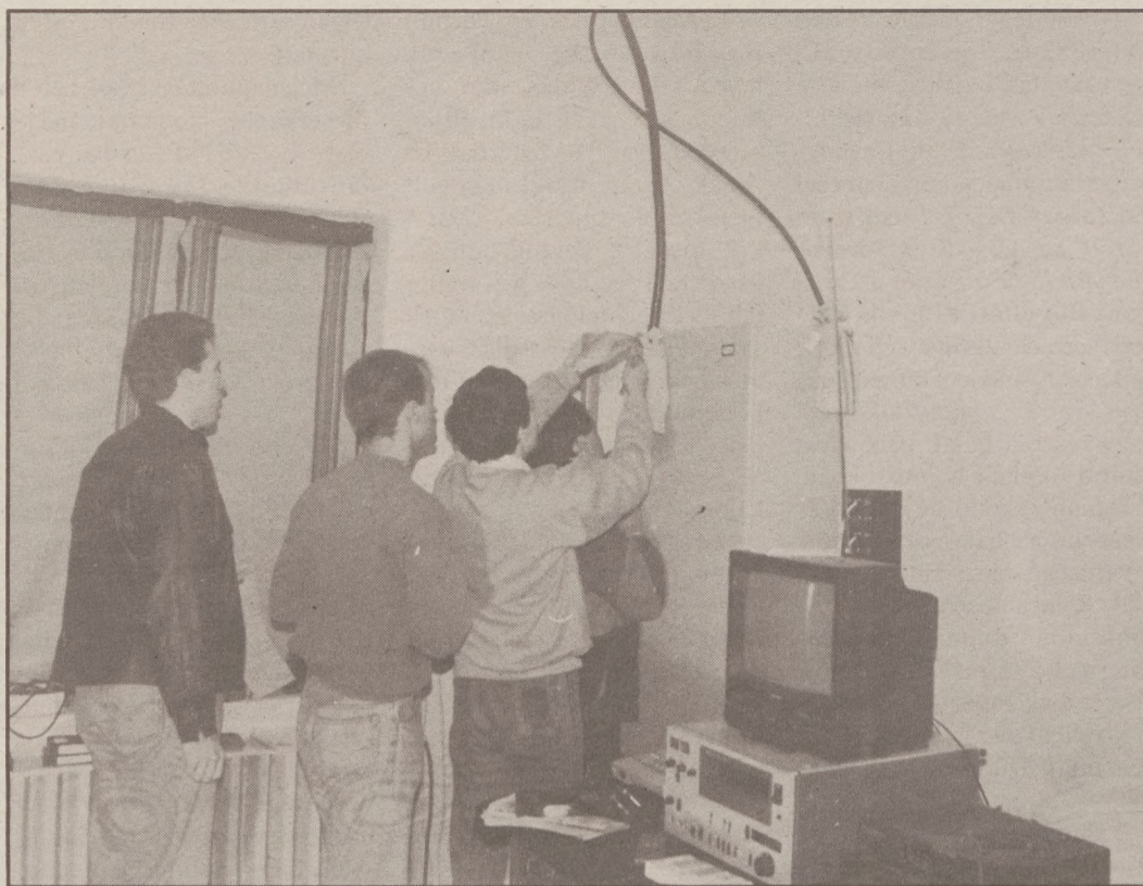
A Dél TV adóberendezése a leszerelés előtti percekben