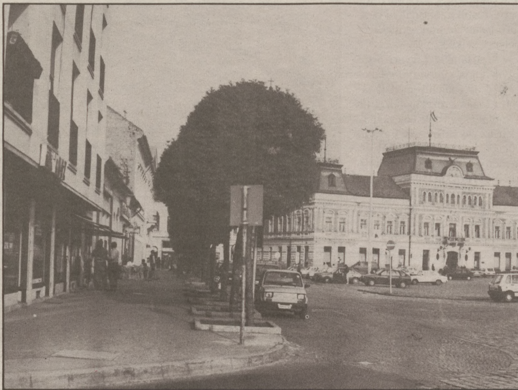
A Szentháromság tér teljes felújítását is tervezik