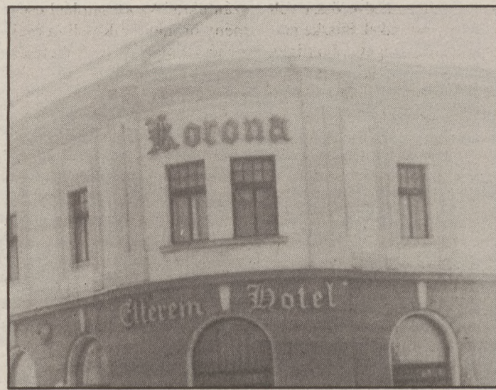
Így múlik el a világ dicsősége