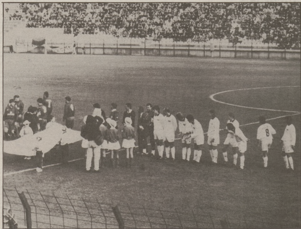
A megnyitó utáni pillanat. Először futottak ki a pályára a csapatok.