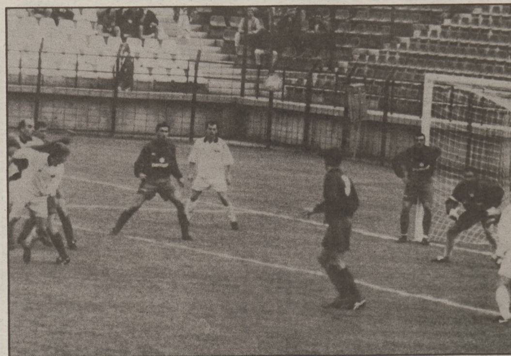
A hazaiak fölénye nem vezetett góllhoz. Disztl mindent megfogott.