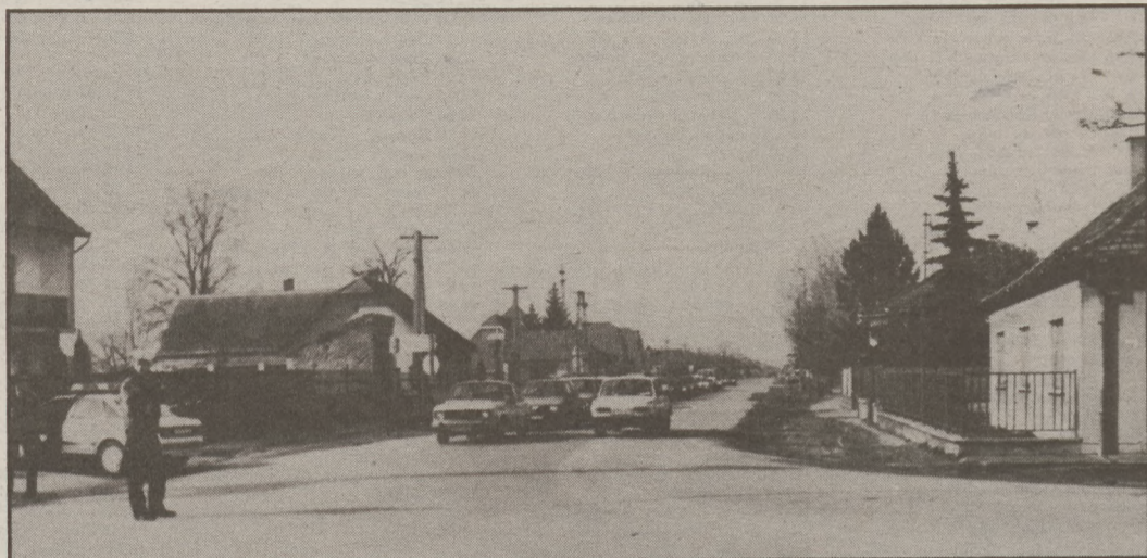
Az akasztói keresztvezetésben rendőrök irányították a kocsik tömegét.

Ezen a hétvégén a Stadler FC a Debrecen csapatát fogadja Akasztón. Érdemes elmenni!