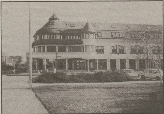
... a vállalkozók házát Kiskőrös belvárosában