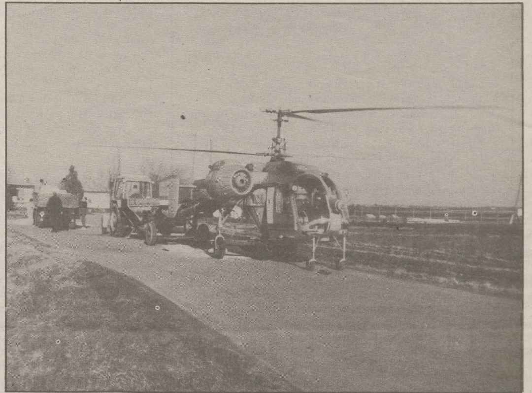
A helikopterek fontos szerepet játszanak az új kukoricakártevők ellen

Az amerikai használatos vegyszert hazánkba még nem ismerjük, azt hétepcséses titok fedi, ennek ellenére a Diabetica-invázió várható idejére további gépeket állítunk munkába. Reméljük, addig a hatóság is rendelkezésre áll, mert a működési területünket és a "támadás" várható irányát figyelembe véve e téren is "fronthar-