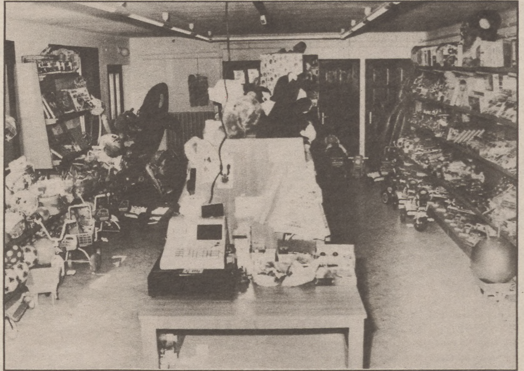
Az Omega Trading Center játékrészlege