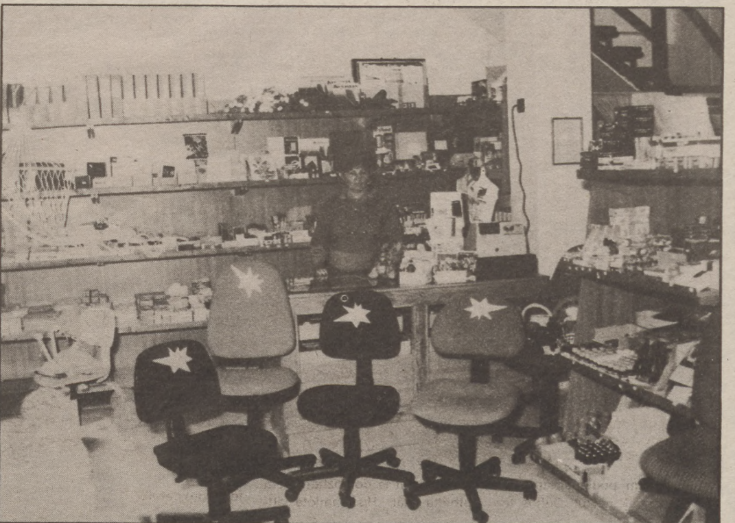
A papír és irodai áruk teljes választéka mellett bútorok is kaphatók