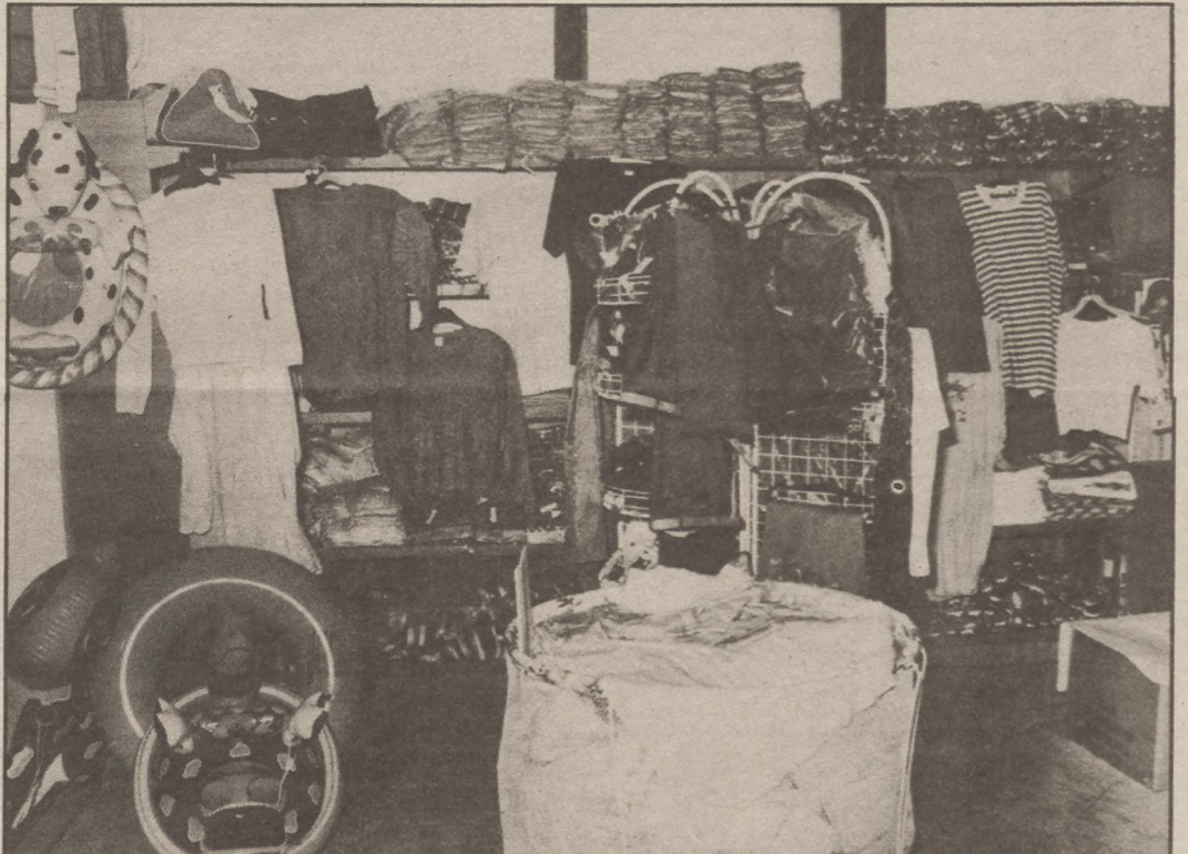
Az üzlet hétről hétre szervez kedvezményes akciókat