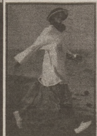
Lányka blúz és szoknya