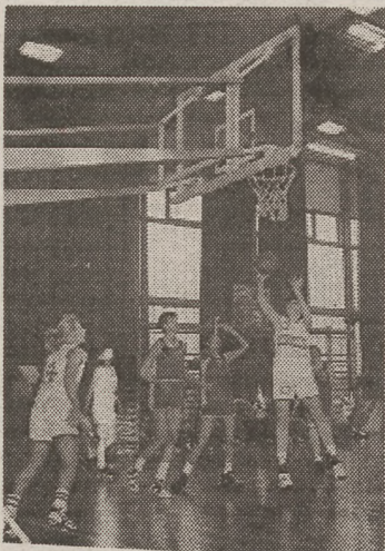
Egy bajai akció a sok közül

A bajai együttes paradiz tüzijátékkal szórakoztatta a közönséget. A magabiztos csapatjáték közben szinte mindig akadt egy-egy játékos, aki ki-magasló teljesítményével hívta fel magára a figyelmet. A hazaiakat dicséri, hogy 50 pontos előny bírtokában is agresszíven védekeztek, letámadták a vendégeket, akik a mérkőzés végén úgy játszottak, mintha gy-