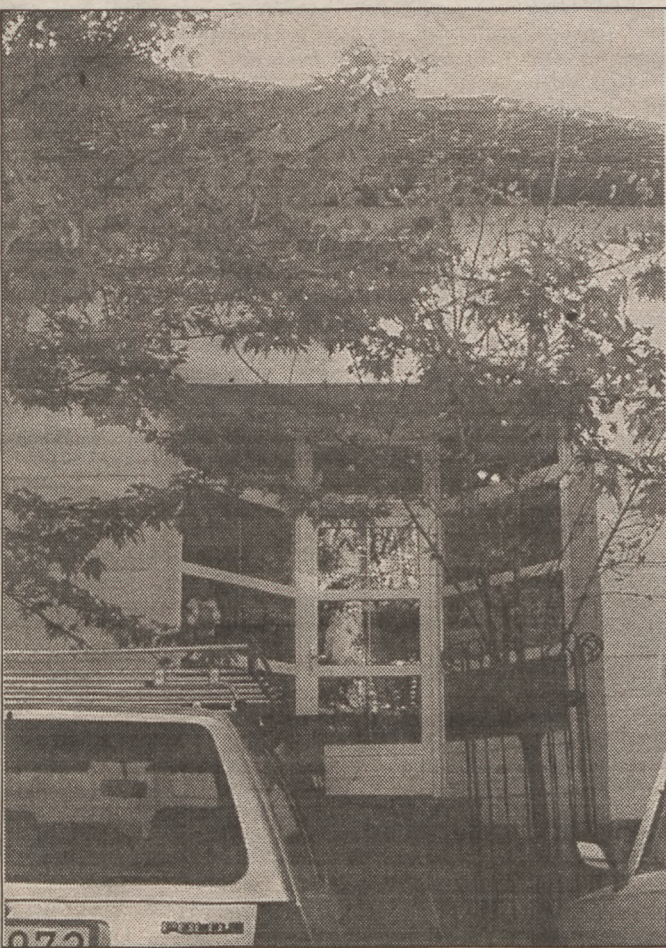
Még egyszer a pontos cím: Baja, Pázmány P. u. 5. (a régi üzlettel szemben).

"Már alszanak, már messze, messze mentek... És míg a Göncöl szekere görög, Ó égi rónákon robnak, A halál álma ez: mély és örök."