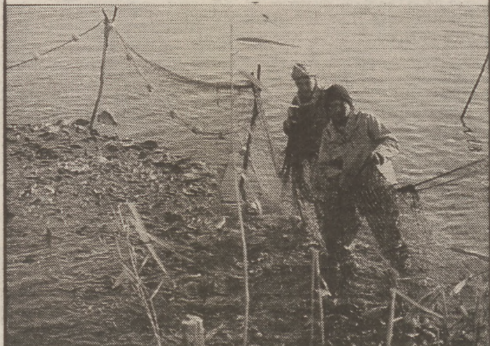
Tele a háló...

A Felsőszentiváni Halastó Bt. 1993-ban alakult. Vízterülete összesen 30 ha, 13 hektáron intenzív halgazdálkodás folyik, 7 hektáron horgászegyesület működik. 10 hektár nádas, halgazdaságra alkalmatlan terület, víztározó jelleggel. Fő profilja a piaci ponty előállítás, természetes hozamú halként kárász, víziszitítás céljából busát tartanak. Az ivadékokat évente veszik. A lehalászás minden évben, október közepére esik. Az idei év a tavalyinál jobb eredményt hozott, távlati célként szeretnék a tőfeneket, illetve a medret kitisztítani külső vállalkozóval, jelenleg ez ügyben a felmérési munkák folynak.