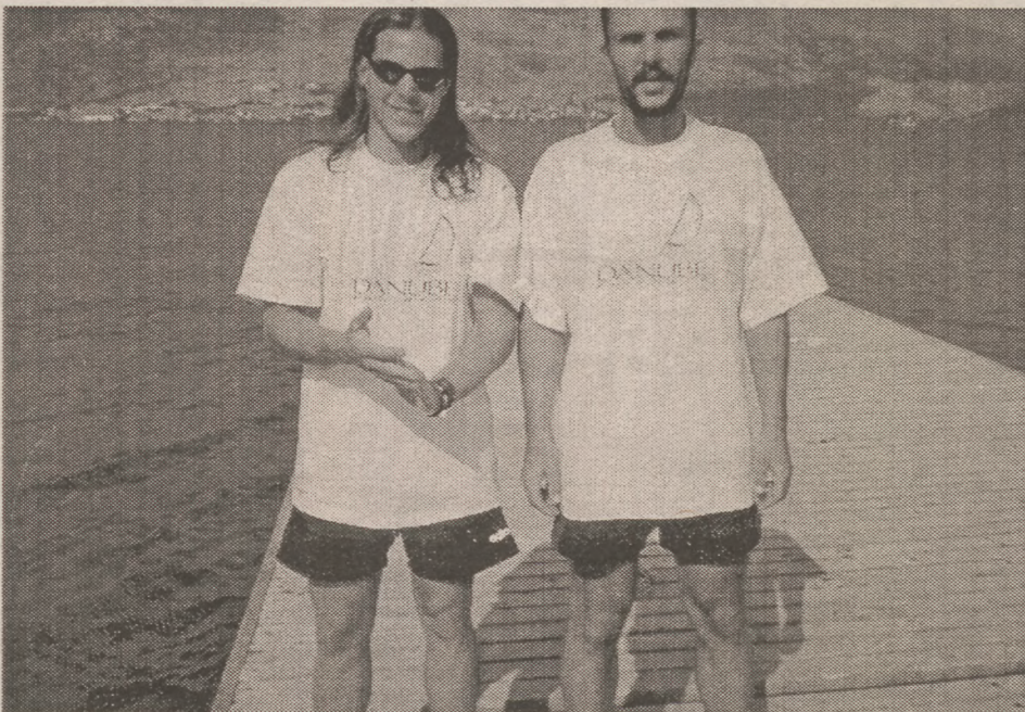
A két versenyző jövőre már a felnőtt VB-re edz

Az izgalom másnap csak fokozódott, reggel nyolckor kezdődött - két ágon - a