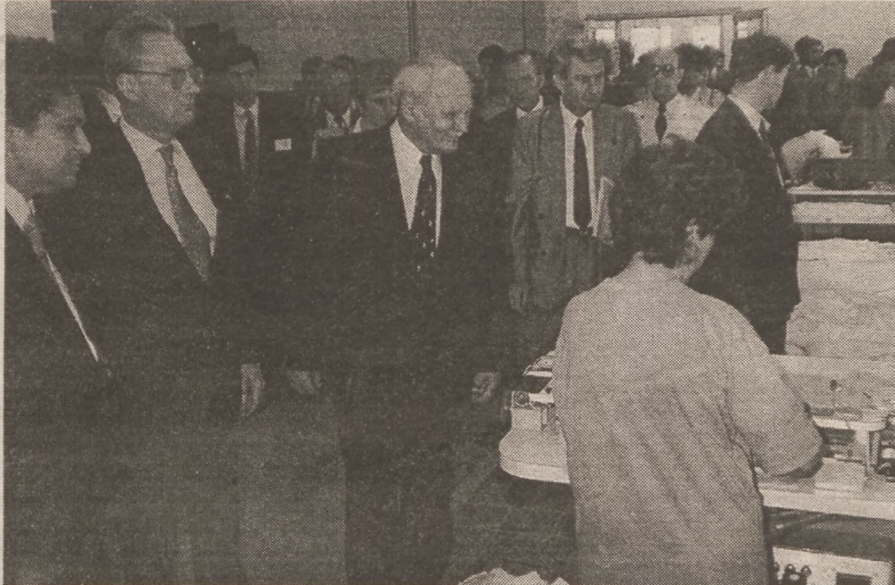
A cég avatásán részt vett Göncz Árpád köztársasági elnök is

A cég tiszta pamutból készített, kiváló minőségű pólókat gyárt, a termékek 100%-át exportálja a világ olyan vezető szabadidő ruházati cégeinek, mint a NIKE, a LEVI'S, a GAP és a Russel. Az elvárt minőség eléréséhez szükséges volt a legmodernebb textilgyártási technológia