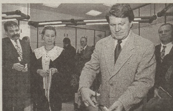
Széll Péter, Baja város polgármestere, az ünnepélyes átadáson

Aki á-t mond, mondjon b-t is! - tartja a mondás, s a jelek szerint az ÁB-AEGON Általános Biztosító Rt-nek ez nem esik nehezére. Könnyű neki, ezzel a névvel! - vélekedhetnénk... De komolyabb a dolog: az ÁB következetesen halad előre megújult stratégiai céljai megvalósításában.