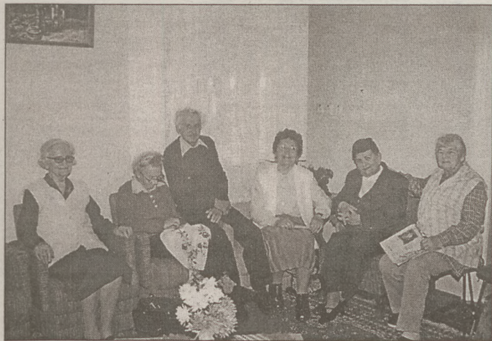
1999. - Az Idősek Nemzetközi Éve

A közelmúltban Baja több intézményében - az Idősek Nemzetközi Éve alkalmából - köszöntötték az időseket. Rendezvényt szervezett a BESZI, valamint a József Attila Művelődési Központ és Ifjúsági Ház is. 1999. november 5-én, pénteken, a művelődési intézmény színháztermébe invitálták a nyugdíjasokat, egy vi-