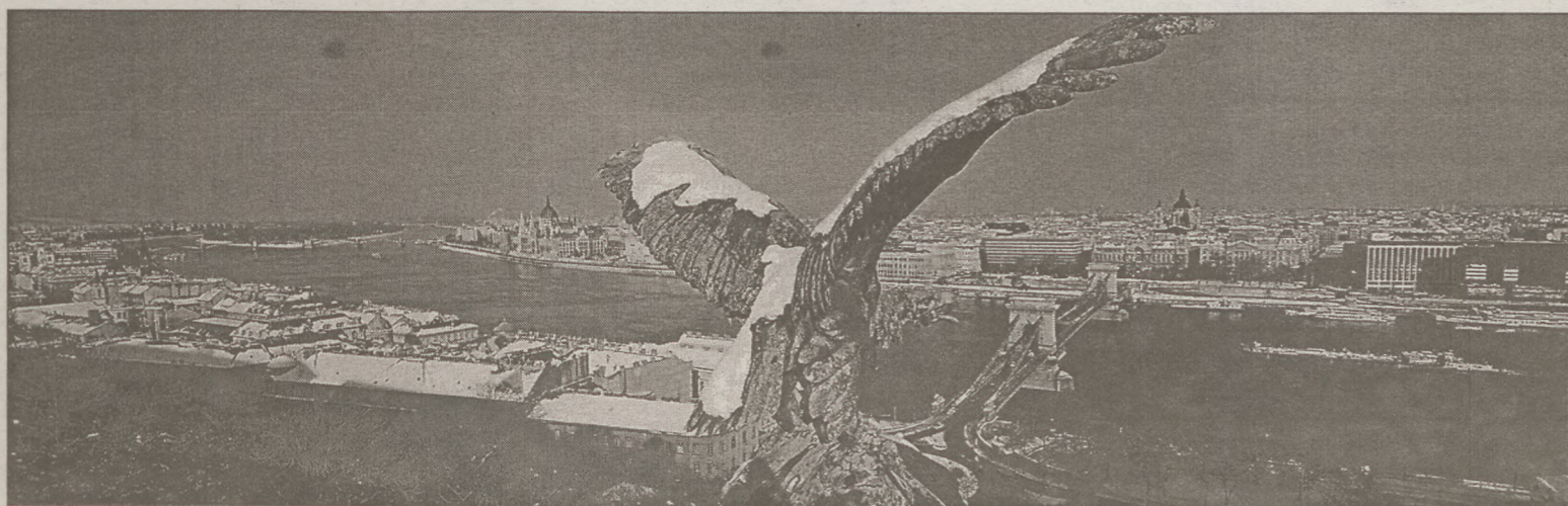
December 1-től kapható Pump Károly Budapestet bemutató millenniumi falinaptára. A művész alkotásával Budapest szerelmeseinek kívánt kedveskedni.

A falinaptár ára 12 500 Ft. Az eladásból befolyó bevétellel többek között a fővárosi hajléktalanokat támogatja. (Részletek a 7. oldalon.)