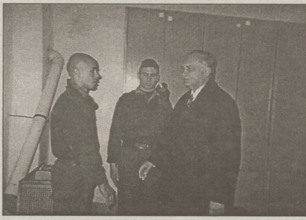
Dr. Szabó János miniszter Bácsbokodról bevonult újoncokkal.

Dr. Szabó János honvédelmi miniszter november 17-én a kalocsai helyőrségben tett látogatást. A délelőtti órákban az Alföldi Kiképző Központban megtekintette a sorkatonák bevonulását.