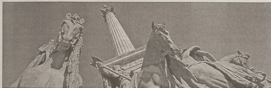
Képeinken részletek láthatók a falinaptárból