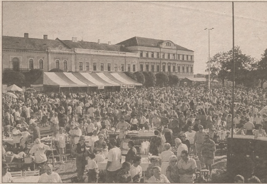
Pillanatkép a hőskorból, anno 1996.

- Most, hogy ismét növe- szik a résztvevők száma, nyil- ván szükség lesz új területek be- vonására, annál is inkább, mert a tavaly is igen nagy volt a zsú- foltság? Mire számíthatunk?