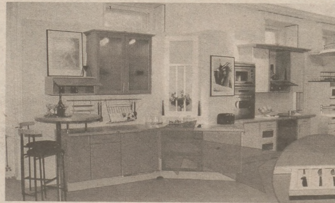
Munkalapba sülyesztett késtartó

12 színben és 6 féle díszítéssel készülnek a konyhaajtók.