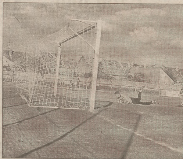
Az egyetlen gól

49. p.: Oross egy az egyben vitte Majzlingerre a labdát, a