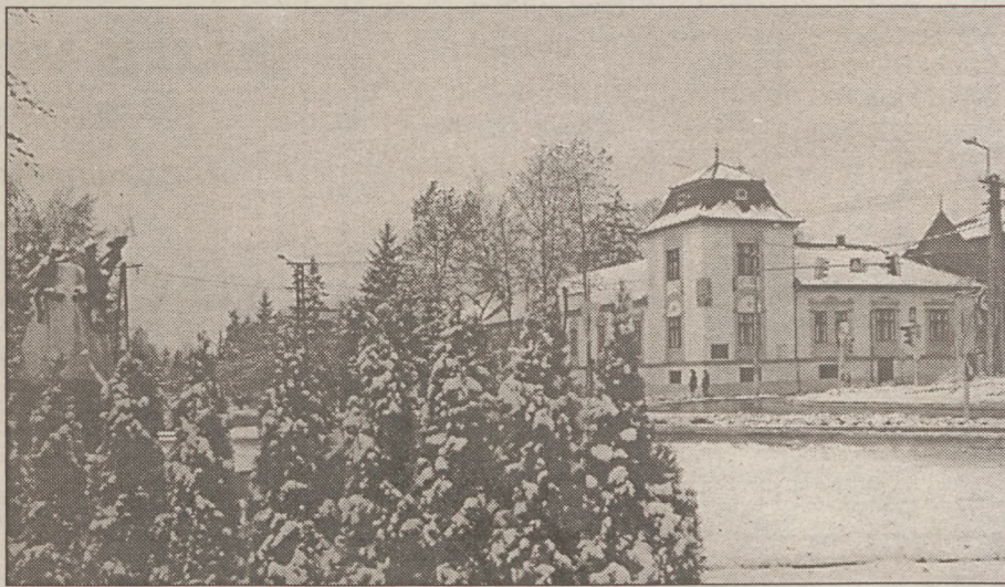
Kecel központja a városházával

Örülök annak, hogy képviselő-testületünk egységes akaratot képvisel. 90