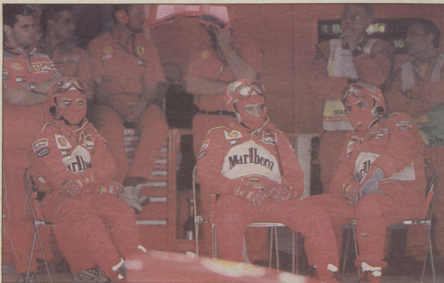
Amikor a szerelők pihennek — két kerécsere között

Óriás műlesiklással és jéggokarttal fejeződött be a Ferrari 11. Nemzetközi Forma-1-es Sajtótalálkozója az olasz sziparadicsomban, Madonna di Campiglióban. A pilóták és újságírók között zajló siversenyben Schumacher ért célba elsőként. Őt a tesztpilóta Luca Badoer és a gyorsasági motoros versenyző, Carlos Checa követte. A délután során a Ferrari pilóták ismerős pályára léptek, a Trento sziparadicsom fagyott tavára. Badoer mellett Barrichello, Schumacher és három másik sztár, a gyorsasági motoros Max Biaggi és Carlos Checa, valamint a rallys Tommi Makinen indult a jéggokart versenyen. Az olasz Alpokban eltöltött hét kellemesen és sikeresen telt el a résztvevők számára.