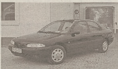
Ford Mondeo 1.6 16 V 1995. 07. benzines. Extrák: légzsák, klíma, rádiómagnó, elektromos első ablakok, pluszkárpit, riasztó, kettős körponton zár, szervó, RS spoiler stb. Műszaki érvényes: 2001. 08. 14. Irár: 1.580.000 Ft. Hírelre is!