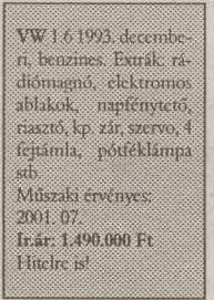
VW 1.6 1993. decemberi, benzines. Extrák: rádiómagnó, elektromos ablakok, napfénytető, riasztó, kp. zár, szervó, 4 fejtámla, pótféklámpa stb. Műszaki érvényes: 2001. 07. Irár: 1.490.000 Ft. Hírelre is!