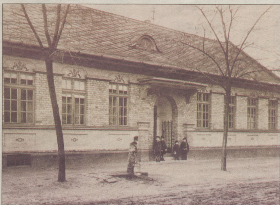
A Madách utcai óvoda (részlet a könyvből)