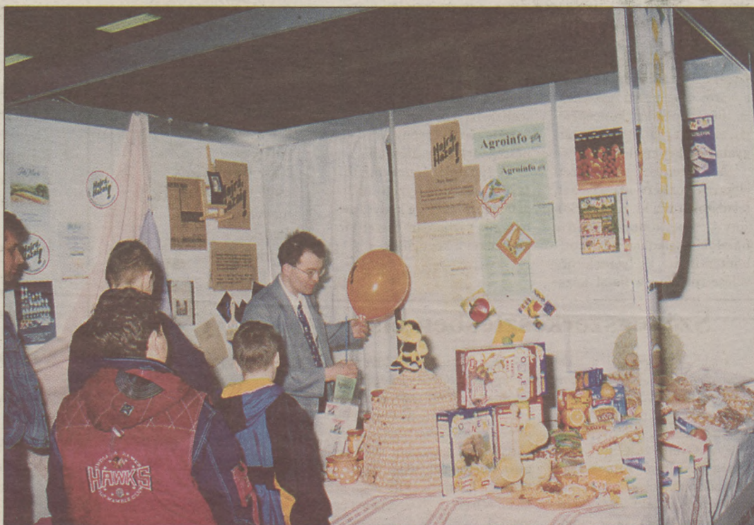
A hangsúly a hazai termékeken van

Sokszínű vásári forgatag várja azokat az érdeklődőket, akik a jövő hétvégén, április 20-a és 22-e között ellátogatnak a Bajai Kiállítás és Vásárra, a fogyasztási cikkek és szolgáltatások bemutatására a Posta Sándor Sportszarnokba. A Sziporka Bt. által immár tizenhetedik alkalommal megtartandó rendezvényen több mint ötven cég mutatja be portékáit.