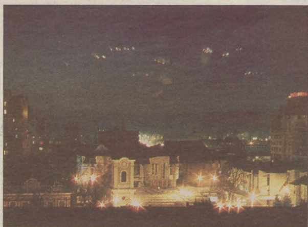
Ünnepi fények a központban (részlet a könyvből)

A könyv írója, szerkesztője Nagy Miklós Kund marosvásárhelyi publicista, számos kiadvány szerzője, a fotókat a marosvásárhelyi Fekete János készítette, a kötet borítónak