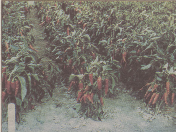
Baktérium ellenálló fajtákat nemesítettek

Anélkül, hogy tudományos fejtegetésbe bocsátkoznék, megemlítem, hogy az ismert gének közül a Bs-