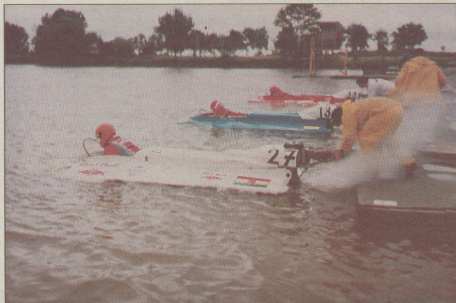
„Él még a bajai motorcsónak-szakosztály!”

A nyári délelőtti a Türr-émlékmű előtti Dunaszakaszon először a hajómódellezők látványos bemutatóját láthatta a közönség, kö-