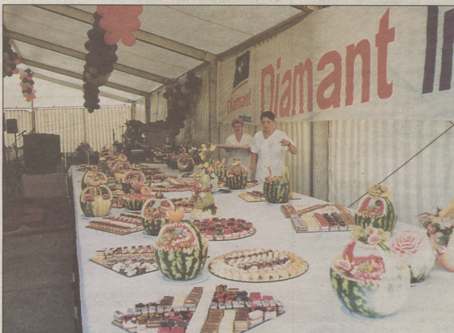
Készül a teríték a Diamant Malom díszvacsorájához