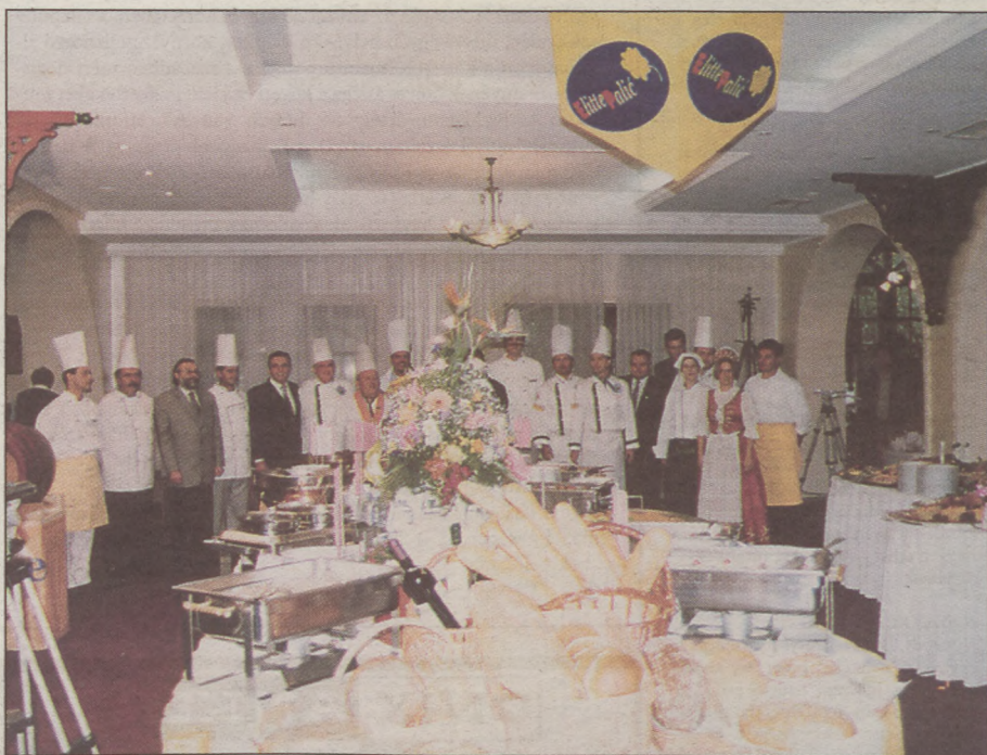
A Gastro Art csapata Palicson, az Elit Étterembe