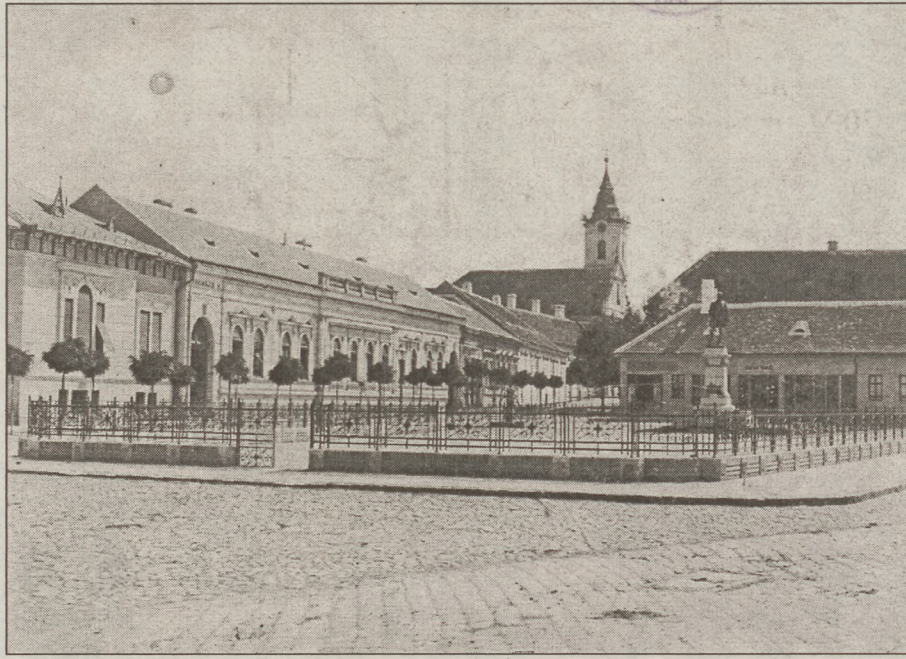
Az egykori Tóth Kálmán tér az 1900-as évek elején. A kép bal szélén a Tomanovics-féle ház, mellette a valamikori kaszinó még földszintes épülete.