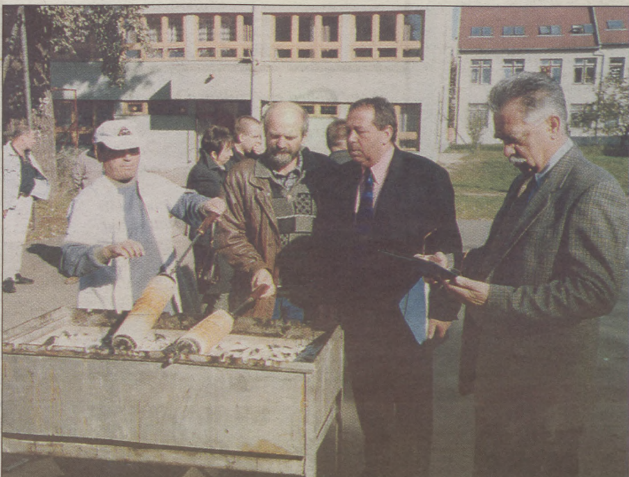
Készül az erdélyiek kürtöskalácsa Kecskeméten