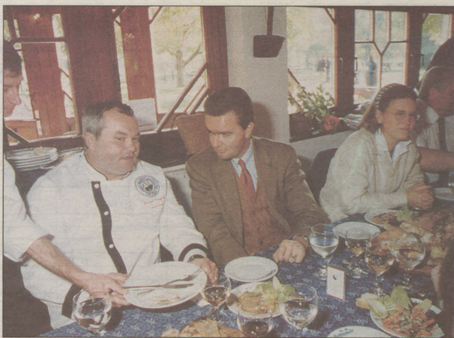
Gergely József, Habsburg György és Eilika hercegnő

- A határon túliak szereplése csak erre az alkalomra szólt, vagy állandó a kapcsolat?