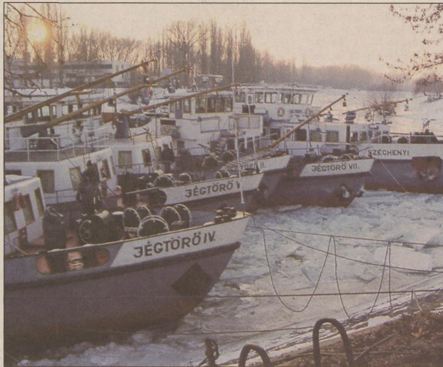
A jégtörő hajók állandó készenlétben állnak a bajai téli kikötőben.