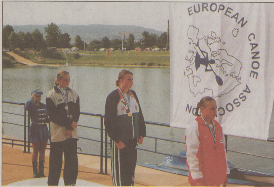
A bajai lány kitűnő versenyzéssel utasította maga mögé ellenfeleit

2002. augusztus 2-4. A bajai kajakos lány két versenyszámban képviselte hazánkat a zágrábi ifjúsági kontinensviadalon, ahol 37 ország versenyzői szálltak vízre. Mindkét számban az előfutamokat nyerve került döntőbe. A szombati kajak egyes 1000 m-es finálé óriási csatát hozott a tavalyi világ-bajnok német lány és a Sugovica-parti kajakos között. A hajrát a németek klasszisa