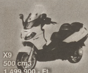
X9 500 cm3 1.499.900,- Ft