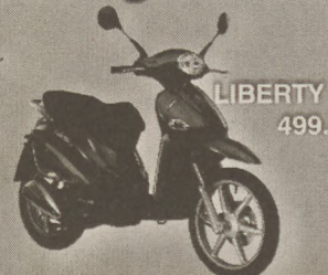
LIBERTY 50 cm3 499.900,- Ft