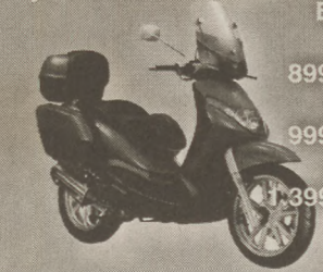
BEVERLY 125 cm3 899.900,- Ft 200 cm3 999.900,- Ft 500 cm3 1.399.900,- Ft