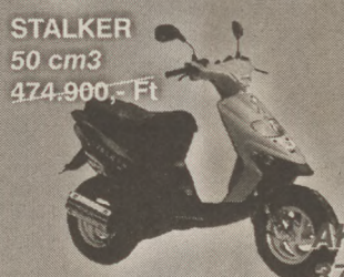
STALKER 50 cm3 474.900,- Ft