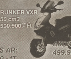
RUNNER VXR 50 cm3 599.900,- Ft