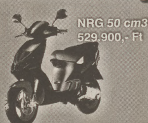
NRG 50 cm3 529.900,- Ft