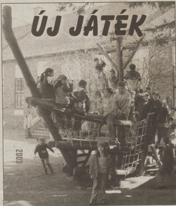
Boldogan vették birtokba új játékukat az Alsóvárosi ÁMK Vöröskereszt téri iskolásai. A fából készült hajót szülői segítséggel és a gyerekek szorgalmas munkájával (papír- és gesztenyegyűjtés) sikerült megvenni.

Lakásszerviz! Javítások, átalakítások minden szakmában! Azonnal házhoz megyünk! Tel.: 06-30/522-5245