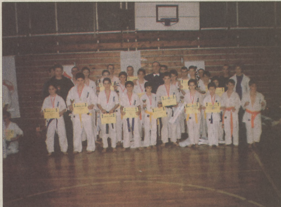
Kern mester sikeres versenyzői körében

Csanylelek, Szivárvány Kupa Országos Utánpótlás Bajnokság, 2003. március 8. 13 klub, 200 induló.