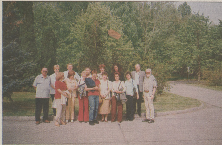
Waiblingen - újvárosi tanárok vendégségben az Újvárosi Általános Művelődési Központban

A hosszú, ünnepi hétvégét (április 30 – május 4.) hat német tanár kollégánk városunkban töltötte. Közülük többen már harmadszor illetve másodszer fogadták el meghívásunkat. A tavalyi gyermekcsere után szándékunk az volt, hogy a felnőttek is barátokra találjanak, így a családok voltak a vendéglátók.