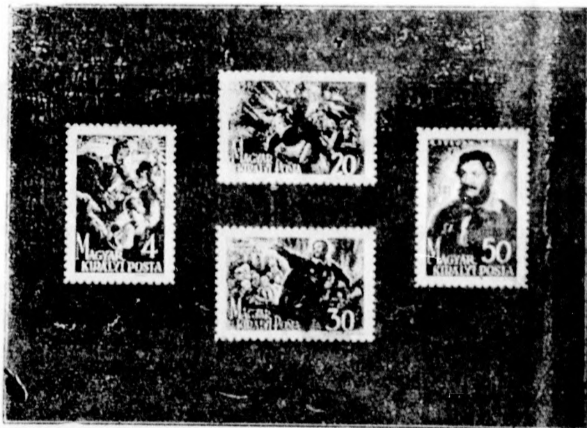
Kossuth emlékbélyeget adott ki a posta.

a Független Magyarország kiadóhivatala. Jelentkezés 12-2-ig