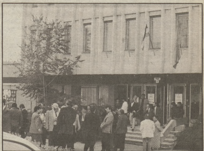
Építészek egy csoportja a tanácskozás szünetében