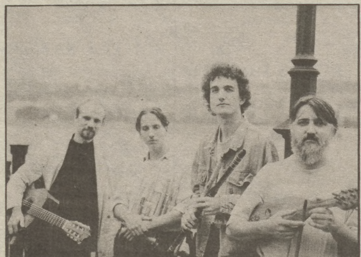
A TIN-TIN Quartett