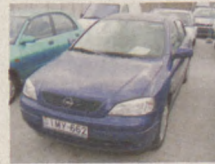
Opel Astra 1.2B 2003.04. Dupla légzsák, szervókormány, elektromos ablakok, elektromos tükrök, rádiósmagnó 1.280.000,-Ft

Ford Focus Kombi 1.8TDDi 2001.01. Fehér 1.280.000,-Ft Dupla légzsák, ülésfűtés, szervó Ford Escort 1.3B 1996.12. zöldesmetál 590.000,-Ft központi zár, riasztó, rádiósmagnó Ford Escort 1.8TD 1994.01. piros 299.000,-Ft Napfénytető, alufelni, riasztó, központi zár, rádiósmagnó Opel Astra 1.6B 1994.01. kék 620.000,-Ft Könnyűfélni, rádiósmagnó, légzsák, szervó Opel Campo 2.5TD Pick Up 4x4 1.200.000,-Ft+Áfa Rádiósmagnó 4 személyes Opel Vectra 2.0TD 1997.01. 980.000,-Ft Klíma, ABS, légzsák, szervókormány Skoda Fabia 1.2B 2004.07. Kékmetál 1.380.000,-Ft Klíma, ABS, központi zár, riasztó, szervókormány, CD-s rádió Suzuki Swift Sedan 1.3B 1997.03. Rádiósmagnó, metálfényezés, központi zár 490.000,-Ft Suzuki Ignis 1.25TDi 2004.17. ezüstmetál, ABS, dupla légzsák, Cd-s rádió, elektromos ablakok VW Polo 1.2B 2002.17. ezüstmetál, rádiósmagnó, 4x légzsák, ABS 1.350.000,-Ft