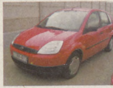
Ford Fiesta 1.3B 2003.07. Servókormány, rádiósmagnó, ülés és kormánymagasság állítás, vezetőlámpa légzsák 1.380.000,-Ft