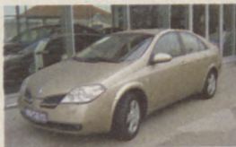
Nissan Primera 2.0B 2003.07. Digit klíma, ABS, 4x légzsák, parkolóradar színes kijelzővel, elektromos ablakok és tükrök, szervó, könnyűfélni 2.199.000,-Ft