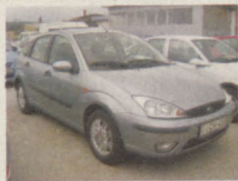
Ford Focus Fresh 1.6B Klíma, ABS, elektromos ablakok és tükrök, távirányítás központi zár, metálfény, könnyűfélni, kódlámpa 2002.06. 1.499.000,-Ft