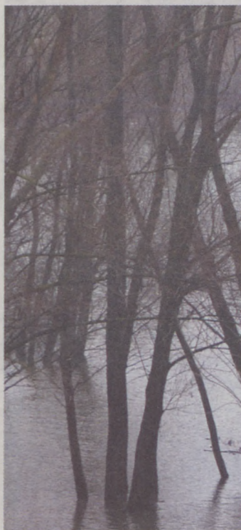
Nyolc méter körül tetőzik a Duna Bajánál

Az előrejelzések szerint január 21-én, pénteken a reggeli órákban 807 centiméter környékén tetőzik a dunai árhullám Bajánál. A város polgármestere másodfokú árvízvédelmi készültséget rendelt el, az Alsó-Duna-völgyi Környezetvédelmi és Vízügyi Igazgatóság első fokon védekezik a folyam bal partján mintegy 65 kilométeren.