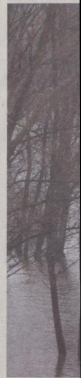
Nyolc méter k... Duna Bajánál