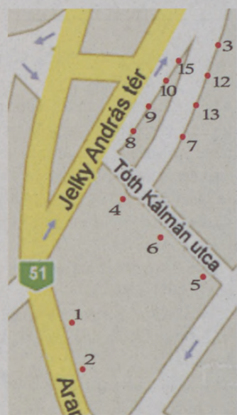
A Jelky A. téren kialakított ideiglenes megálló számozása