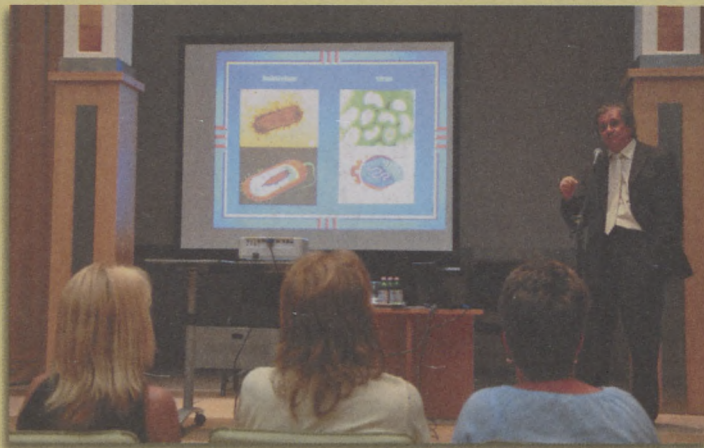
Dr. Mészáros Gyula fotókkal illusztrálta a betegség következményeit.

A Humán Papillóma Vírus (HPV) okozta betegségekről és a kórokozó ellen adható védőoltásokról tartottak lakossági tájékoztatót június 2-án a Bácskai Kultúrpalotában. Mint már beszámoltunk róla, a helyi önkormányzat az idei évtől kezdve a 13 éves bajai lányoknak ingyenesen biztosítja az ún. négykomponensű védőoltást a HPV ellen.