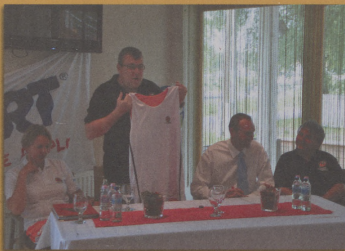
A Rátgéber Akadémia egy önálló védjegye, a tábor lakóinak sportruházatát is ez a márka díszíti majd – mutatja a mesteredző

A jelentkezés még nem zárult le, de már 300 fiatal regisztrált a táborra. A két hét alatt több nemzetközi és hazai edző, valamint helyi