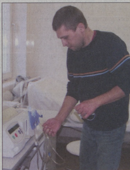
Hasi dialízisre is van lehetőség Baján

A Baja Vagyon Zrt. , (6500 Baja, Árpád tér 1.) mint hasznosító - Baja Város Önkormányzata Képviselőtestületének 45/2007. (XII.17.) sz. Baja Város Önkormányzata vagyonáról, a vagyon feletti tulajdonosi jogok gyakorlásának és a vagyon kezelésének szabályozásáról szóló rendeletének értelmében - meghirdeti az alábbi - önkormányzati tulajdonban lévő - ingatlanokat értékesítésre: