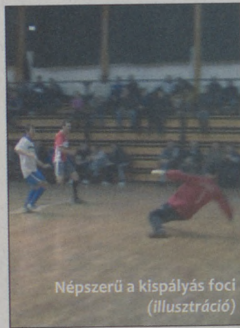
Népszerű a kispályás foci (illusztráció)

Az ünnepélyes eredményhirdetést követően megtartották a szabadterei bajnokság sorsolását is