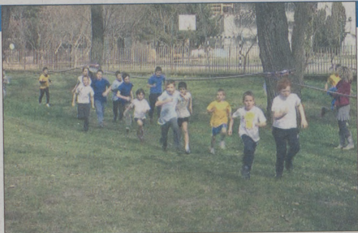
Népszerű a mezei futóverseny

Baján a mezei futóverseny minden évben jelentős tömeget mozgat meg. Talán azért is, mert számos