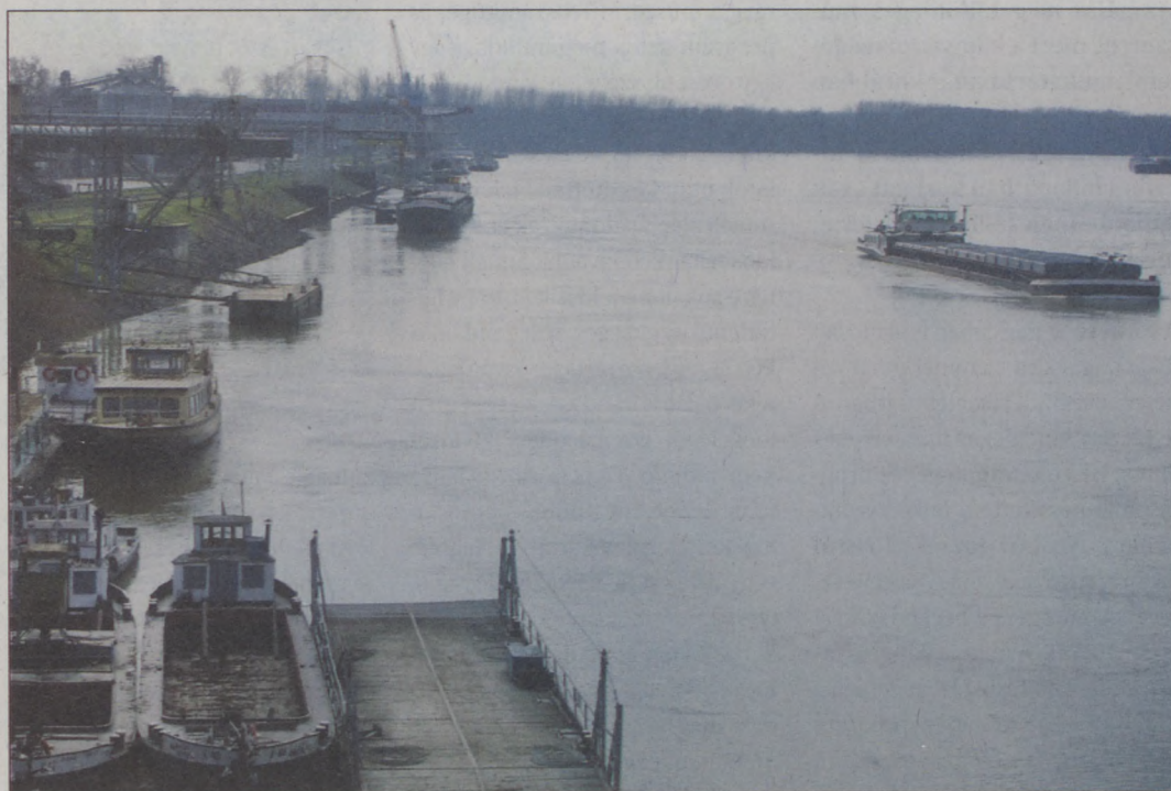
Mindig nagy a forgalom a Dunán, vele a Bajai Országos Közforgalmú Kikötőben is

Az összegyűjtött adatokat a program központjában, Görögországban dolgozzák fel. Azt vizsgálják, hogy a közúton szállított árut mi módon lehetne vasúton vagy hajón eljuttatni a célállomásra. Per-