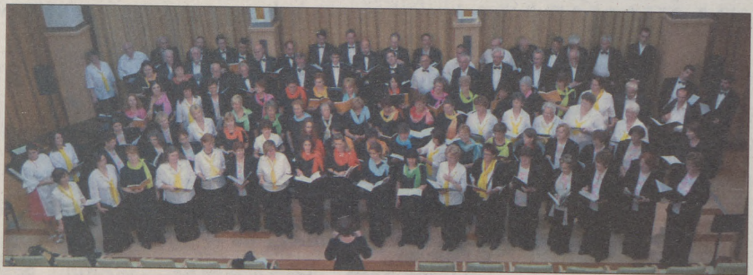
Immár a Bácskai Kultúrpalota a Kórusfesztivál állandó helyszíne

CSODÁLATOS BAJA Öt évvel ezelőtt szervezte meg első alkalommal a bajai Liszt Ferenc Énekkar a Pünkösdvárosi Kórusfesztivált, melyen a zenekedvelő bajaiak a kórusmuzsika színes palettájával ismerkedhetnek meg. Az első találkozót a főiskola Bajcsy-Zsilinszky utcai dísztermében, a másodikat az MNÁMK aulájában rendezték meg, majd 2011-ben a Bácskai Kultúrpalota fogadta be a rendezvényt. Azóta ez az állandó helyszín. Az elmúlt négy évben a következő kórusokat hallhattuk: Celldömölki Liszt Ferenc Vegyeskar, Építők Kamarakórus Budapest, Musica Beata Kórus Szentendre, Zenekedvelők Kórusa Kaposvár, Liszt Ferenc Pedagóguskórus Szekszárd, Kis Szent Teréz Kórus Keszthely, Liszt Ferenc Vegyeskar Százhalombatta, Veszprém Város Vegyeskara, Ad libitum Kórus Baja, Összhang Kórus