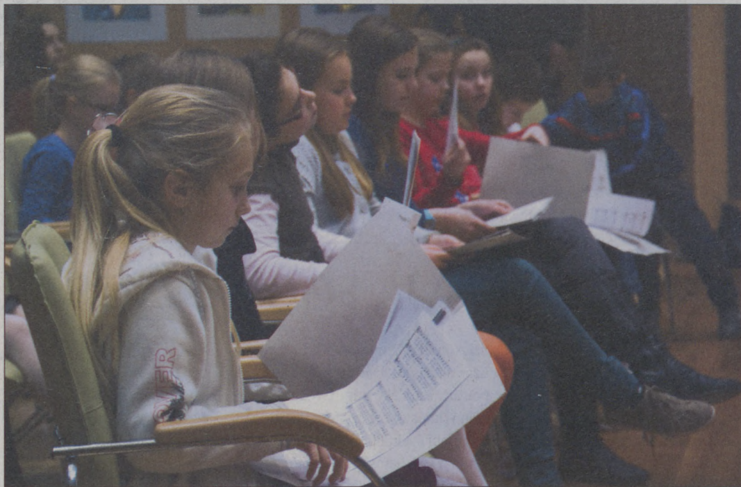
A gyerekek lelkesek, nagyon élvezik a próbákat és a gyakorlásokat