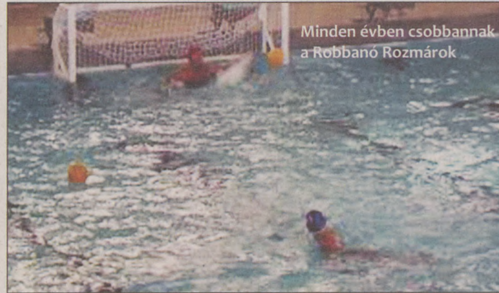
Minden évben csobbannak a Robbanó Rozmárok