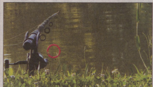
Figyelem, kapás van!