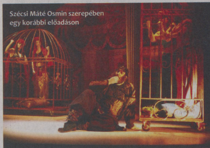
Szécsi Máté Osmin szerepében egy korábbi előadáson