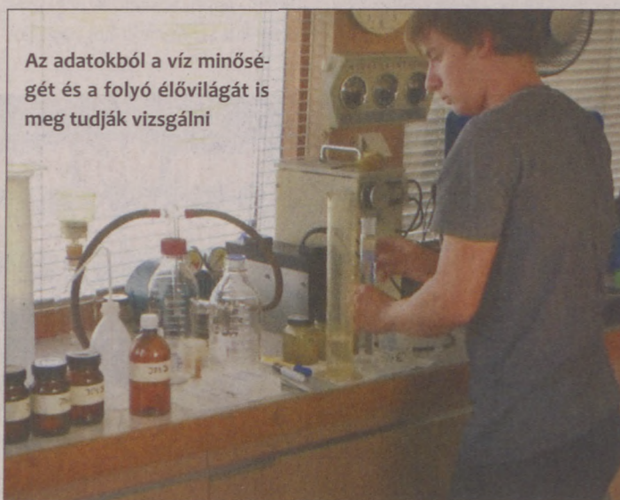
Az adatokból a víz minőségét és a folyó élővilágát is meg tudják vizsgálni