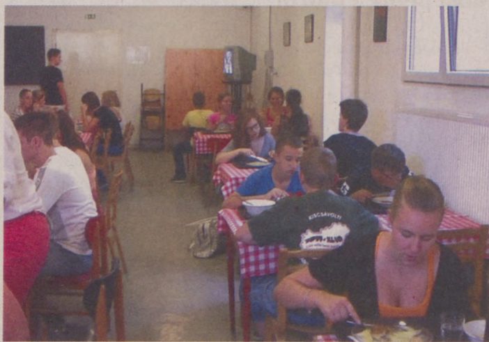
Baján sokan veszik igénybe a menzát