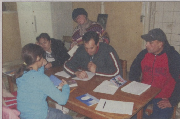
Sok programot szerveznek a IV. kerületben

végzettségek megszerzése után nagyobb eséllyel találnak munkát. A képzéseket a TKKI végzi.