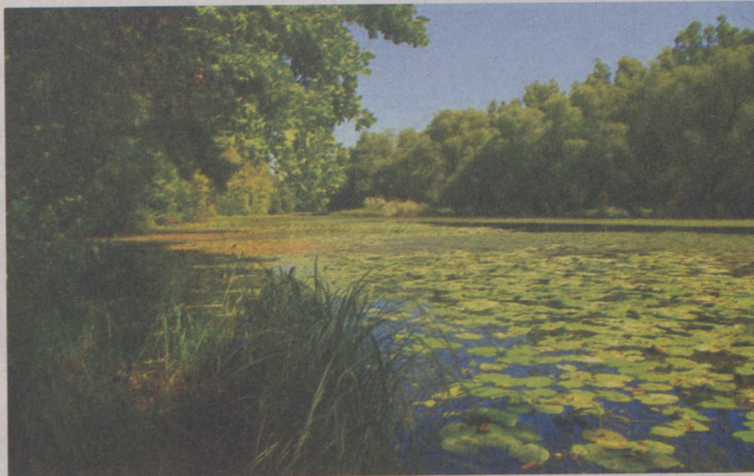
A gemenci Káposztás-tó is megújulhatott

A beavatkozás elsősorban azokra a fajokra – ponty, széles kárász, compó, szivárványos ökle – lehet pozitív hatással, amelyek a lassan áramló vagy az állóvizet kedvelik. A halpopulációk stabilizálódása a vidra, a rétisas, a fekete gólya és a gemfélék állományát is erősíti.