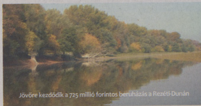
Jövőre kezdődik a 725 millió forintos beruházás a Rezeti-Dunán

res átfolyó ága a Dunának. Ám a felső szakasz feltöltődése miatt nem tud befolyjni a mederbe a víz, ezért lesüllyeszti a küszöbszintet. A beavatkozás azoknak a halfajoknak, például a leánykócérnak, kedvez majd, amelyek szeretik a folyamatos áramló vizet. MTI