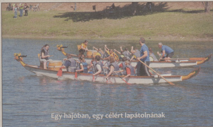
Egy hajóban, egy célért lapátolnának