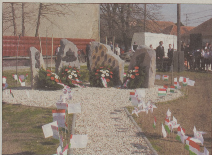
BAJA ÉS KÖRNYÉKE BÁCSKAI NAPLÓ 2014. MÁRCIUS 27.