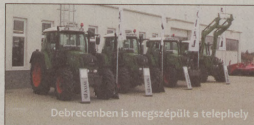
Debrecenben is megszépült a telephely

A vállalkozás fejlesztési programja nem ért véget. Hamarosan Csornán, Orosházán, Békéscsabán és Szekszárdon is munkálatok kezdődnek. BAJAI TV