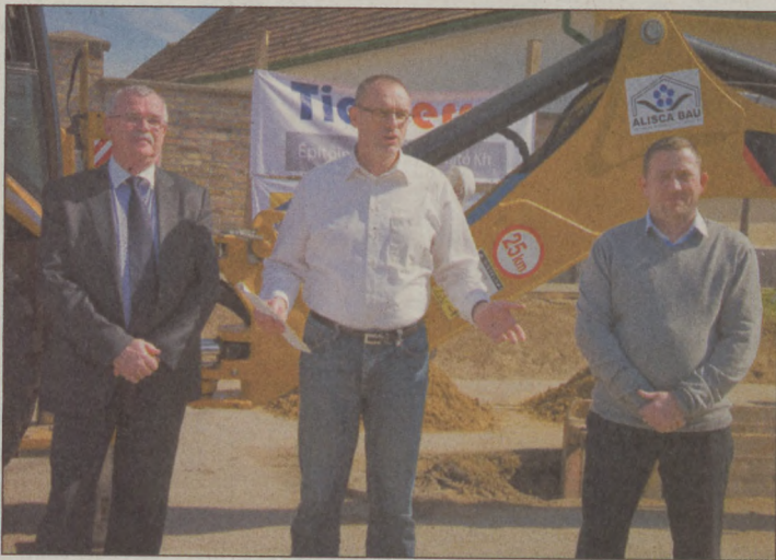
BAJA ÉS KÖRNYÉKE BÁCSKAI NAPLÓ 2014. MÁRCIUS 27.

A beruházás végső határideje 2015 márciusa.