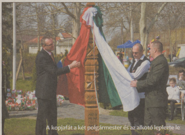
A kopjafát a két polgármester és az alkotó leplezte le