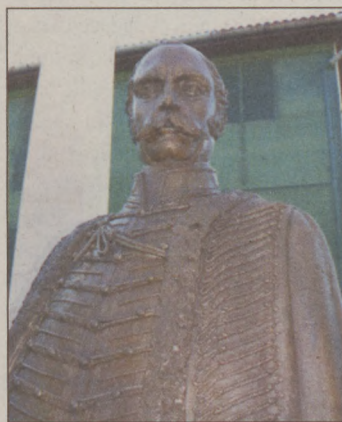
KÉPVISELŐ-TESTÜLET Bronz mellszobor készülhet Baja szü-

löttéről, Mészáros Lázár hadügyminiszterről. A bajai képviselő-testület csütörtökön rendkívüli ülésen tárgyalta a pályázatról. Másfél millió forintot meghaladó támogatás nyerhető (1.592.640 Ft), míg az önerő 682.560 forint. A kulturális bizottság három helyszínt vizsgált meg, végül a belvárosi Aradi-vértanúk emlékműve mögötti, háromszög alakú terecskét javasolta. Az ülésen az alkotó, Harmath István szobrászművész és Lehoczki Imre városi fő-