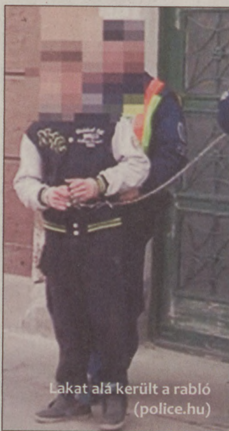
Lakat alá került a rabló