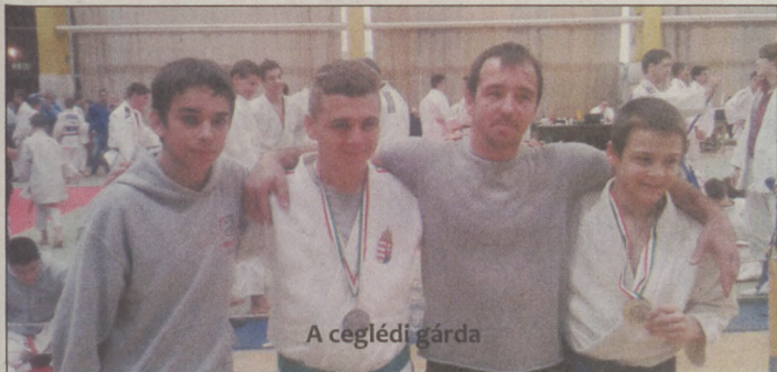
A ceglédi gárda