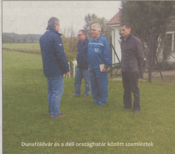
Dunaföldvár és a déli országhatár között szemléztek

A felülvizsgáló bizottság a szakaszmérnökségek létesítményeit a belvízvédekezés, valamint a mezőgazdasági célú vízszolgáltatás ellátására alkalmasnak minősítette.