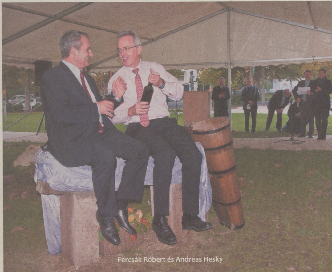
Fercsik Róbert és Andreas Hesky

BAJA/WAIBLINGEN A kellemes, nap-sütéses sétaidőben szép számú érdeklődő, vendég és a vendégeket fogadó bajai jelent meg október 24-én, délután a Turisztikai Központ melletti Testvérvárosi Parkban. Az ünnepélyes átadás alkalmával Andreas Hesky főpolgármester kiemelte azt az óhaját, hogy a Waiblingen köveiből készült pihenőpad legyen újabb jelképe a két város közötti hagyományosan jó, testvéri együttműködésnek.