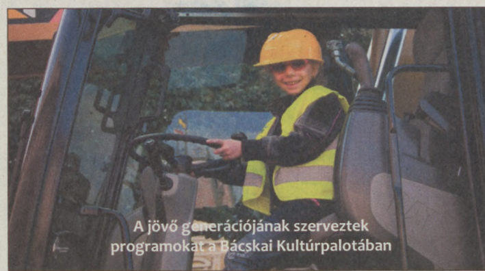
A jövő generációjának szerveztek programokat a Bácskai Kulturpalotában