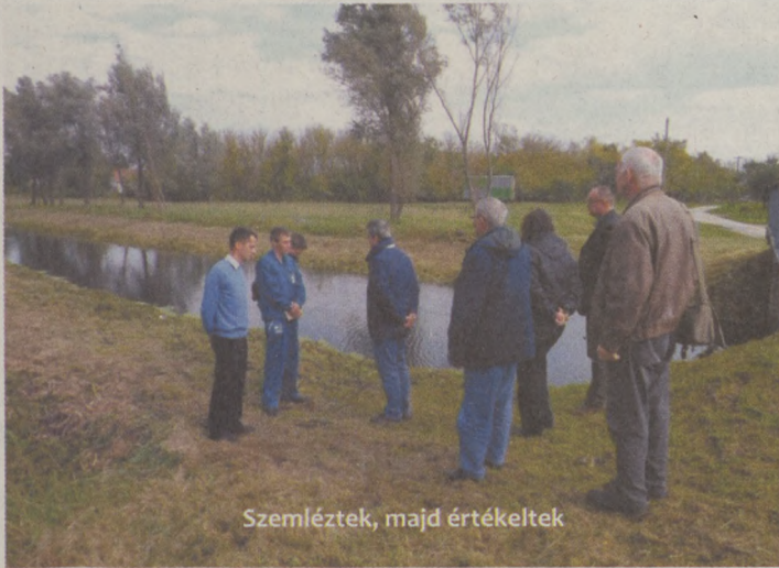
Szemléztek, majd értékelték

VÍZÜGY Megtartotta az árvízvédelmi fővédvonalak őszi felülvizsgálatát az Alsó-Duna-völgyi Vízügyi Igazgatóság bizottsága október 20-21-én. Mindkét napot a szakaszmérnökségek beszámolója nyitotta, amelyben szó esett az elmúlt évben végzett beruházási és fenntartási munkákról, valamint a megoldandó feladatokról.