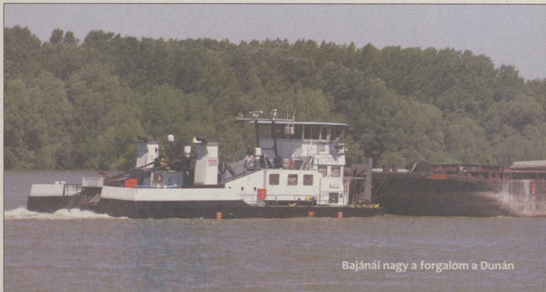
Bajánál nagy a forgalom a Dunán

Nemzetgazdasági és vagyonpolitikai szempontból is kiemelkedő jelentőségű fejleménynek nevezte, hogy a magántulajdonba került hajózási gazdasági társaságok visszacszerzésével fokozódott az állam dunai hajózásban betöltött szerepe. Személyhajózási stratégiai szempontból megkerülhetetlen a MAHART PassNave Kft., amely a Duna teljes szakaszán a legnagyobb működő hajóparkkal rendelkező személyhajózási és kikötő-üzemeltető társaság.