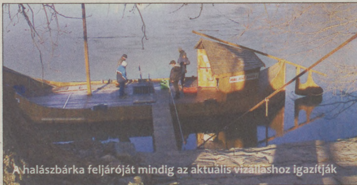
A halászbárka feljáróját mindig az aktuális vízálláshoz igazítják

DUNA A jelentősebb mennyiségű csapadék és az ezzel párosuló hóolvadás következtében a Dunán számottevő árhullám vonult le. Bajánál 550 centi alatt tetőzött az elmúlt hétvégén. A vízügyi igazgatóságnál jelentősebb árvízvédelmi beavatkozásra és intézkedésre nem volt szükség.