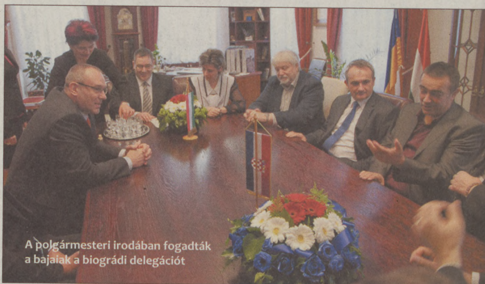
A polgármesteri irodában fogadták a bajaiakat a biográdi delegációt