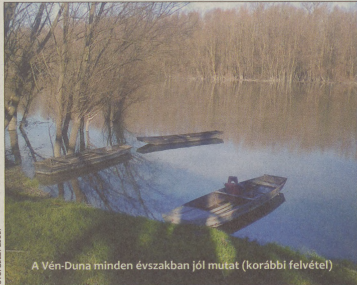
A Vén-Duna minden évszakban jól mutat (korábbi felvétel)