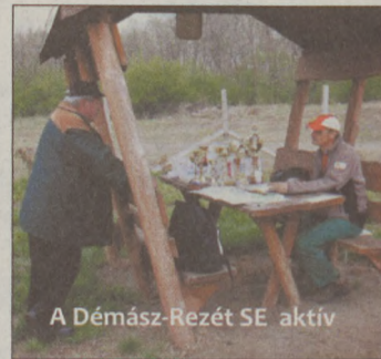
A Démász-Rezét SE aktív