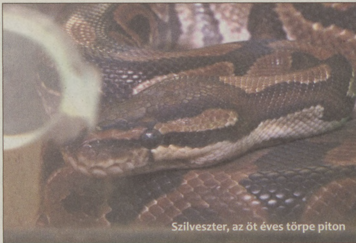
Szilveszter, az öt éves törpe piton