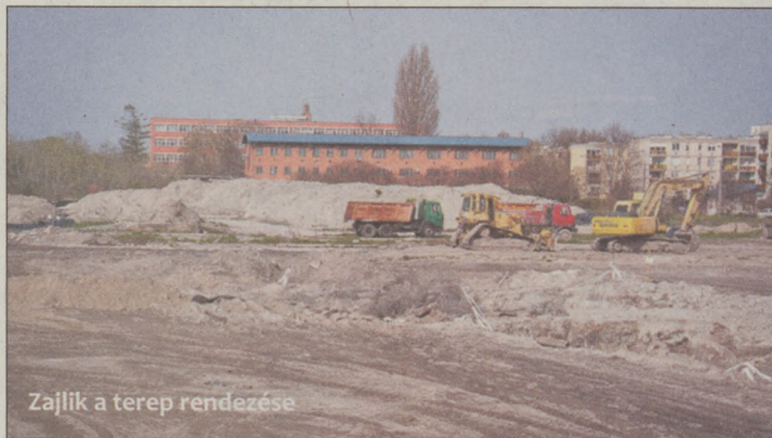
Zajlik a terep rendezése

42 méter mély rézsűfalat építettek a töltésbe is