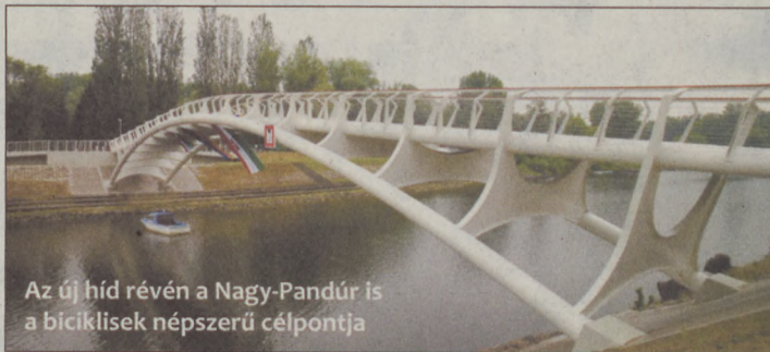
Az új híd révén a Nagy-Pandúr is a biciklisek népszerű célpontja