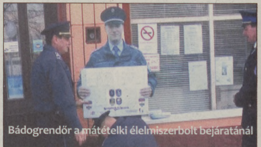
Bádogrendőr a mátételki ételbárpult bejáratánál